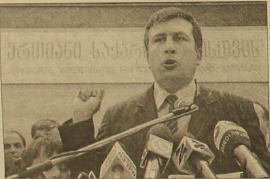
Վրաստանի նախկին նախագահ Էդուարդ Շեւարձեանը:

Անեոս, այսօր արդեն, երբ Վրաստանում իրականացվել է ղեկավարող հեղափոխումը եւ իշխանությունից հեռացվել է երկրի օրինական նախագահը, անհեթեթ է մեղքորումներ անել Վրաստանի սահմանադրությունից: Պարզապես իհրեցնենք, որ Շեւարձեանն իշխանության էր ելել նույնպես ղեկավարող հեղափոխումն արդյունում, երբ իշխանությունից հե-