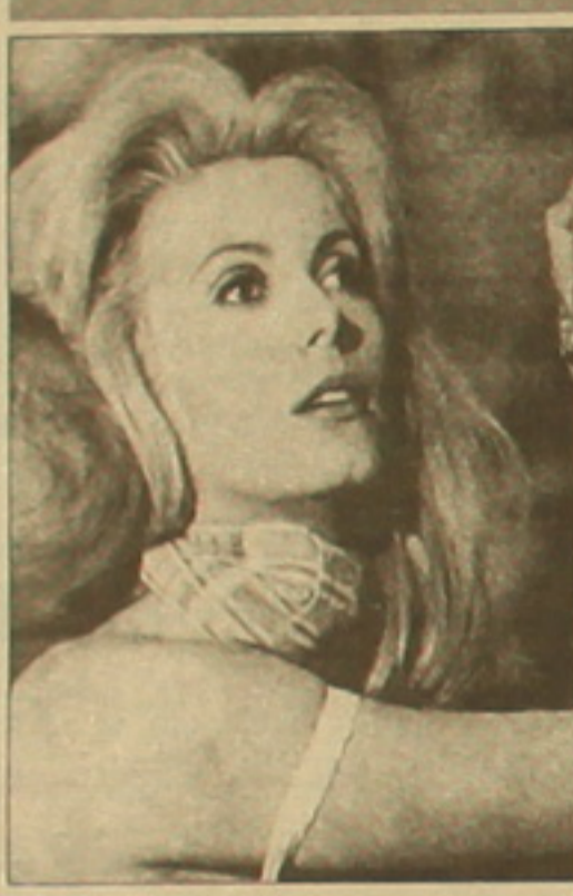
Կասրին Դեյնոյեթ Բուսյունի «Յերեկային զեղեցկուհին» ֆիլմում