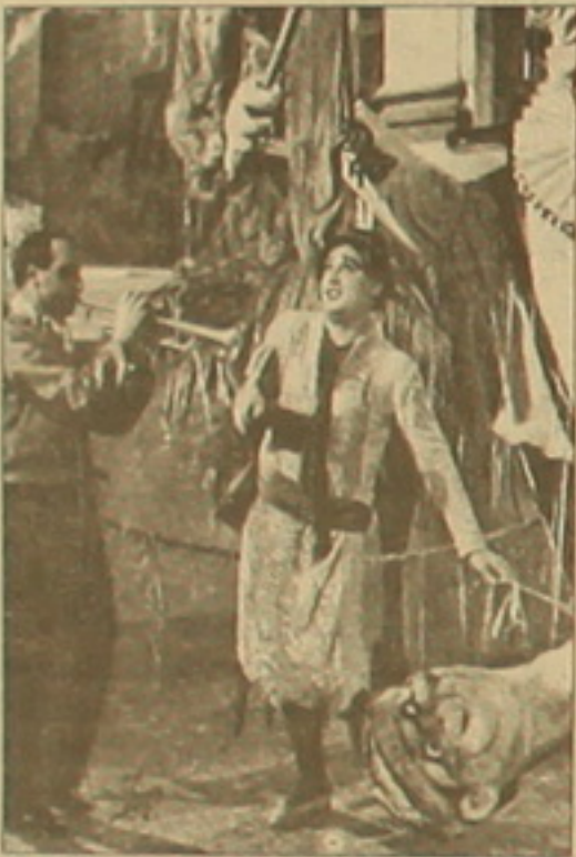
Ալբերտ Սորին Ֆելիքսի «Մայրիկի բալաները» ֆիլմում