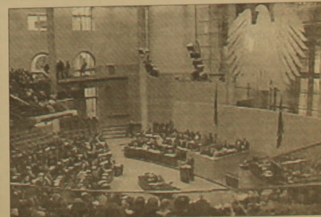
մտադիր չեն դա անել, չնայած բանակցությունների ինտենսիվ փու-

ԲՐՅՈՒՄԵԼ, 12 ԴԵԿՏԵՄԵՐ, ԱՐՄԵՆԴՐԵՍ: Բրյուսելում բացվել է Եվրամիության գազաթաժողովը, որտեղ առաջադրվել է լոստոնջի կառավարությունների ղեկավարների կողմից Եվրամիության լոստոնջի մեջ առաջին միասնական սահմանադրության հաստատման հարցը: Այն կեսի երկու օր եւ խոսաստում է լինել արտաքին բարդ եւ դրամաշիկ, քանի որ Եվրամիության լոստոնջի միջեւ լոստոնջի մեջ գազի արտադրությունները Սահմանադրության նախագծի օրը: Այժմ սահմանադրության օգտին լոստոնջի մեջ փեարկելու Եվրամիության 19 անդամ եւ անդամության թեկնածու երկրների ղեկավարները: Վեց երկիր, ներառյալ Իտալիան եւ Լեհաստանը, առայժմ