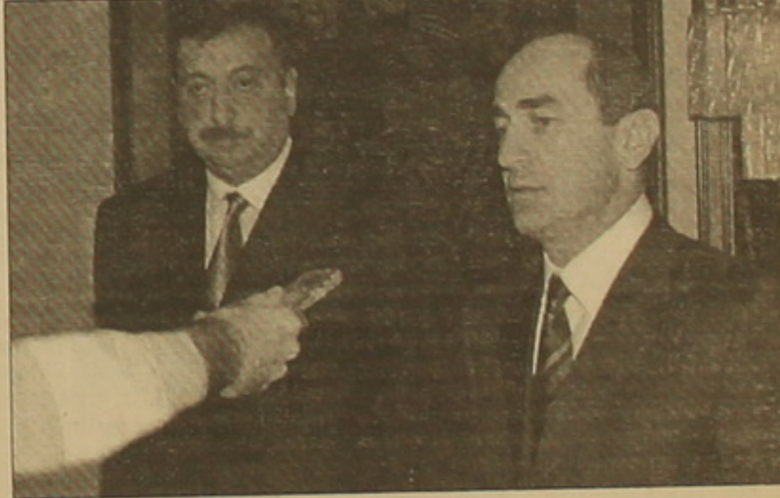
ԵԱԳԿ-ի Լեոնային Ղարաբաղի խնդրով Մինսկի խմբի համանախագահ, Ռուսաստանի արտգործնախարարության հասուկ հանձնարարությունների ղեկավար Յուրի Մեդվեդևը: Ռու-

բնակչության մնացած՝ գերակիռ մասի հաւովին հնարավորինս շատ հարսանալու նմանակով: Այս սարին եւս բացառություն չկազմեց: Ավելին, համառոտն օրջանավոր լուրերը էլեկտրոնային, ջրի եւ գազի սակագների բանկացման մասին, հացի բանկացումը հավելյալ իրարանցում ստեղծեցին շուկայում, որից չհաղադեցին օգտվել եւ արտադրողները, եւ առեւտրականները: Երկուսն էլ համերաւոյութեն ձեռնամուխ եղան աղանջների մեծածախ եւ մանրածախ գների բարձրացմանը, իբր սղասվելիք բանկացումներից չհուժեղու համար: Սակայն ակնհայտ է, որ նմանակն այս օրերին խիստ մեծացած դահանջարկը (կարելի է անվանել ճարահայտլ դահանջարկ) բավարարել է: Ի վերջո, նման առիթ, բնակչության կեսից ավելին աղիւտ համարող երկրում, կլինի մեկ էլ հաջորդ սարի այս օրերին: