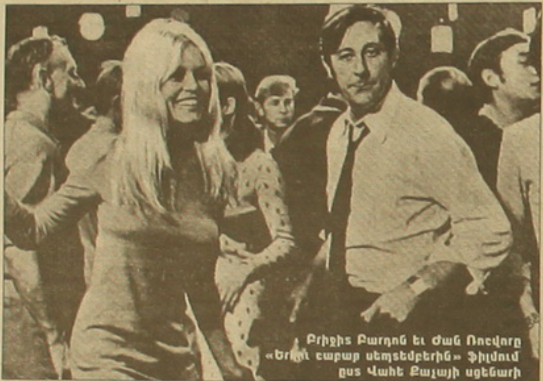
Բրիջիտ Բարդոն և Ժան Բոկոլորը «Երկու շաբաթ սեռաբեկերին» ֆիլմում ըստ Վալտեր Բայայի սցենարի