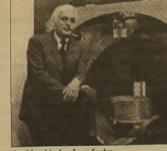
Իր հե կիսել մրցանակը: Ի ղեո, Նոբելյան մրցանակի Եոնրի-ման կանոններն արգելում են փոփոխել անվանակարգից հանձնաժողովի որո-ւումները: Պ. Բ.

Տամայանի կարծիքով, Նոբելուրի Եւ Մեեսֆիլդի աԵխասանը կառուցվել է իր արտոնագրած հիմնարար հայեոա-գործության վրա: Բժկության ասղա-բեում 2003 թ. Նոբելյան մրցանակի ղահիներին անունների հրաղարա-կումից հեոն Տամայանը ՉԼՄ-ների մի-ջոցով Նոբելուրից Եւ Մեեսֆիլդից ղա-հանջել էր ուղղել անարղարությունը Եւ