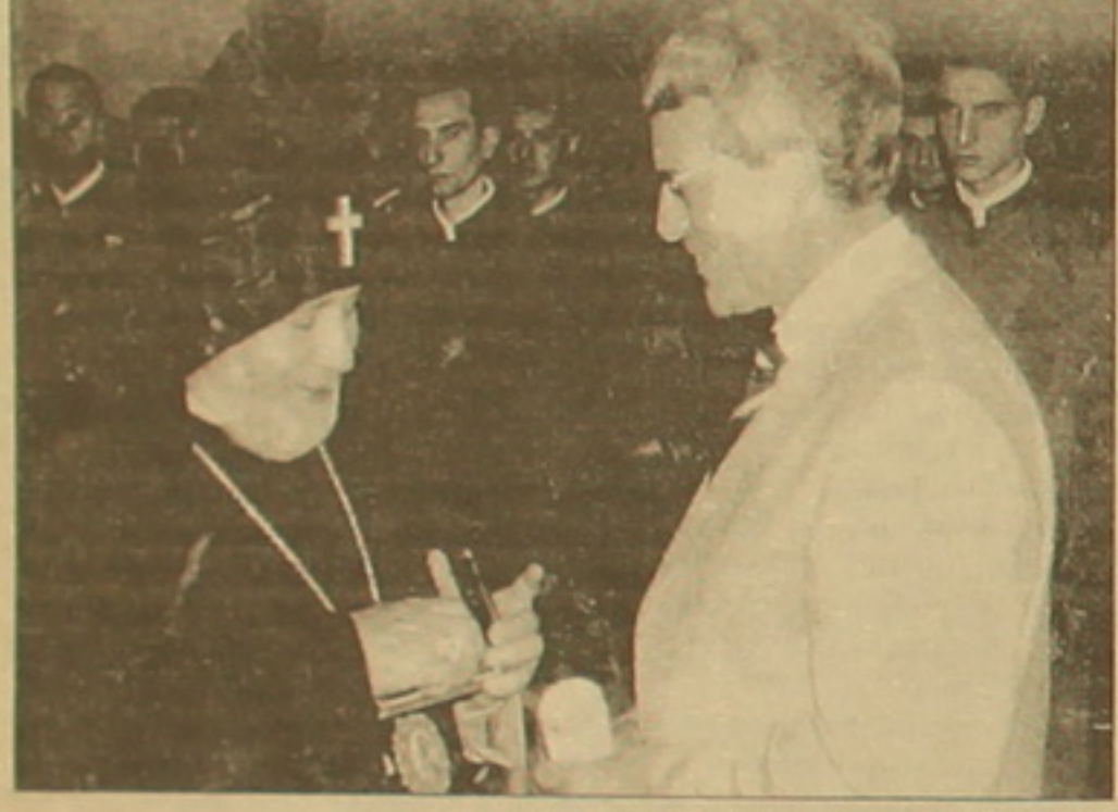
3. Գոլցը Ամենայն հայոց հայրապետի շնորհած «Ս. Սահակ-Ս. Սեւրոմ» շնորհած սահմանափակ:

վերակարծի, հակառակ ԳԳԴ իփսանությունների ցանկությանը, 3. Գոլցը կարողանում է Հայելում անցկացնել 3. Լեփսիուսի հիշատակին նվիրված առաջին միջազգային համաժողովը, իսկ ապրիլ ամսին Լեփսիուսի գերեզմանի վրա (Մեռանոյում, Հարավային Տիրոլ) դրվում է հայկական խաչաքար: 1987 թ. միջազգային համաժողովի նյութերը 3. Գոլցը հրատարակում է առանձին գրով: 1988-1993 թթ. 3. Գոլցը եվրոպական եկեղեցիների խորհրդի հետազոտությունների բաժնի սնորեն եւ մասնակցել է Ամենայն հայոց կաթողիկոս Վազգեն Առաջինի ու աղբյուրական լեյնի ու իսլամի բանակցություններին: Տարիներ շարունակ 3. Գոլցն աշխատանքներ եւրոպական վերակազմելու շարունակ Հայ դպրի մեծ դասախոս 3. Լեփսիուսի Պոստամուն գեղարվեստը: Դրան խանգարում էին գերմանիայում հավասարազրկված թուրք դիվանագետները եւ որոշ թուրքամետ գերմանացի ֆաղափականներ: 3. Գոլցը ղափանցի մեջ է մտնում նրանց դեմ եւ կարողանում է գերմանական հեռուստատեսության առաջին ծրագրով հեռարձակել իր «Հայերի ցեղասպանությունը եւ վախկոտ ֆաղափականները» հաղորդումը: Ի վերջո 2003 թ. նրա ջանքերն ավարտվում են հաղթանակով, եւ 3. Լեփսիուսի շնորհած արձագանք վերականգնվում է: