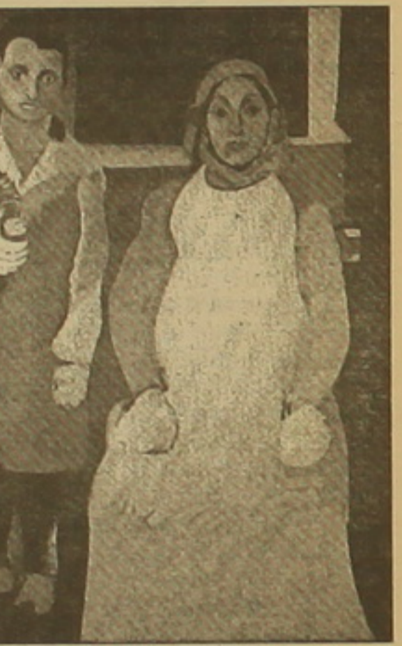
«Նկարիչն եւ իր մայրը»