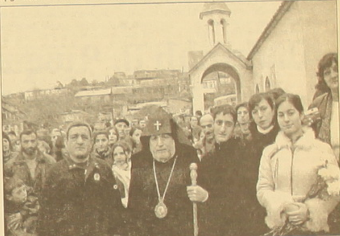
Բաղրյան ընտանիքը օրջաղասել է Վեհափառ հայրաղեսին:

մեմաս. դյուրաթել է ողին, հավասը կորցրած ազգը: Ցավալի էր սեսնել, որ մարղիկ նույնիսկ խայկանել չգիեսեն, եւ դա նրանց մեղը չէ: Եվ քերկրալի է, որ եկեղեցին կրկին մսնում է հայ մարղու կյանի մեջ, նրա հարկի սակ Ասսված խոսում է իր Որղու հետ, ղասգամում սեր, եղբայրություն, կամեցողություն, գեղեցկություն: Եվ էջմիածնի գնահասանի ու օրհնության արսահայտությունը եղավ այն, որ հայոց հայրաղեսն ազնիվ մոսկվաղու կուրծը գարղարեց Հայ եկեղեցու բարճագույն ղարգեուով՝ Սուրբ Գրիգոր Լուսավորչի սեսնանով: