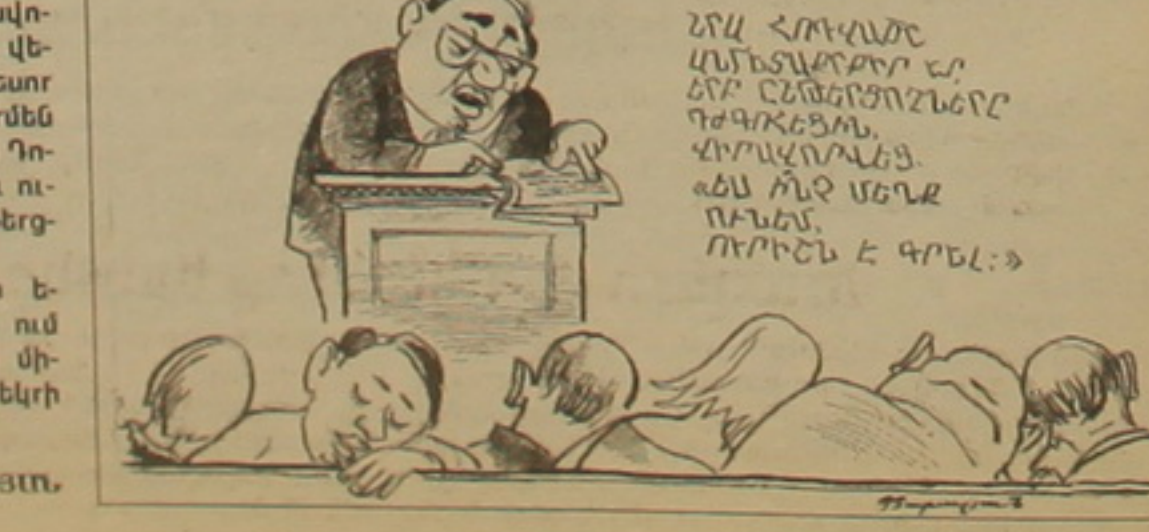
ՄԱՐԻԱՄ ՄԵԱՐՈՅ ԱՐՔ. ԱՇԽԱՐԻՍ