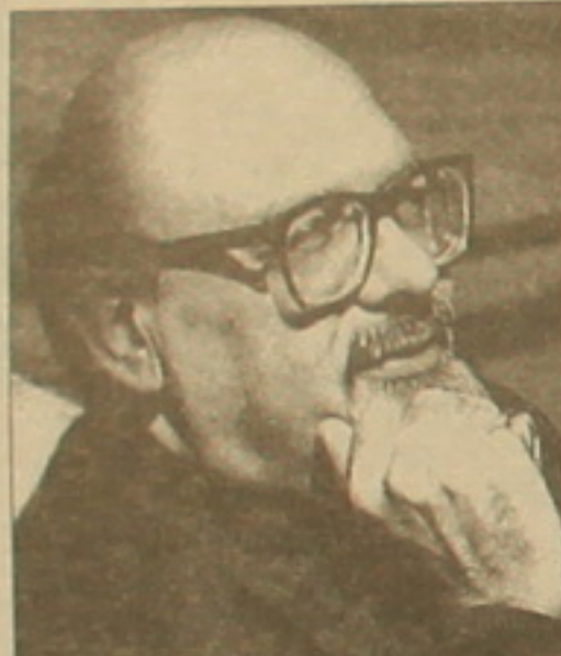
ՉԿԱ ԱՅԼԵՍ ՄԵԱՐՈՅ ԱՐՔ. ԱՇԽԱՐԻՍ

Մի ֆանի ամիս առաջ Սուղնու վանքում կազմակերպել էր Գրիգոր Նարեկացու «Մասեան ողբերգութեան» 1000-ամյակի տոնահանդես, որն ինքը սուկ ցերեկույթ էր կոչել: Բանախոսներին, արհեստներին, երաժիշտներին ինքն էր ընտրել, ինքն էր սեր կանգնել երաժշտական ծեսավորմանը: Այսինքն արքայանք Նարեկացու վայել էր «Մասեանին» վայել մթնոլորտ էր ստեղծել: Անոգեղեն մեր ժամանակներում, երբ մեր ակամքները ծուլացել ու ծանրացել են ֆաղափական ճառերից ու նվազանցներից, իսկապես ոգեղեն մի օր ամբողջին: