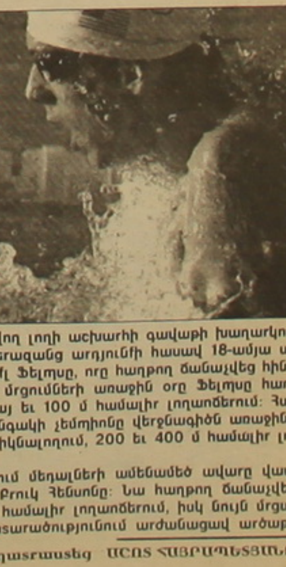
Էջր տարտասեց ԱՇՏՏ ՎԵՐԱԿՈՒՅՏՆԵՐԸ