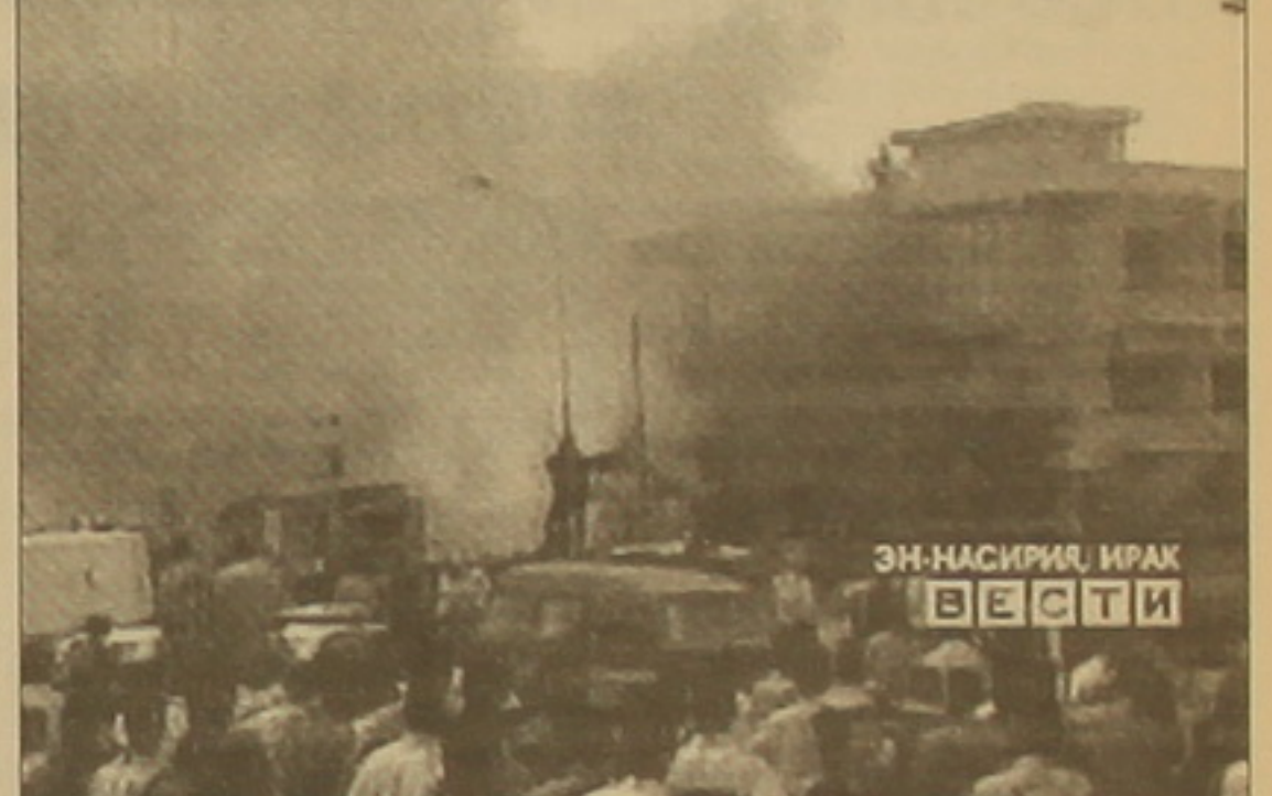
ՅՈՒՆԱՍԿՐԱՆ ԻՐԱԿ ԵՍՏԻ

րահսկողությունը մեծելու, այլև նրանց անկախ գործելու և ինքնուրույնություն դաժանելու: Հետևաբար, Թուրքիային ոչ այնքան ոգեւորում է Վրաստանի ժամանակավոր իշխանությունների ամերիկաներ դիրքորոշումը, որքան մտահոգում Աջարիայի վերահսկողության բացակայությունը: Դա լուրջ հիմքեր ունի, որոնցից թերեւս կարելի է առանձնացնել նաև Աջարիային վերադարձվող սարանցիկ միջանցիկ դերը: Այսինքն, եթե Ադրբեջանի և Թուրքիայի ցամաքային կառուց Վրաստանն է աղափոխում, ապա Վրաստանի հետ Թուրքիան անմիջական կառուց է հաստատում հենց Աջարիայի միջոցով: Ուրեմն, Աջարիա-Վրաստան կառուց խզման դեմում Թուրքիան ակամա կանգնում է Վրաստանի միջոցով Ադրբեջան, այնտեղից էլ Միջին Ասիա դուրս գալու հնարավորությունից զրկվելու փաստի առջև: Թեև նրա է դասձառը, որ թուրքական հանրային հեռուստատեսությունը, որն Իրանից ներթափանցում է, նույնպես 27-ին Վրաստանի իշխանափոխությունը լայնախառնում էր Էդուարդ Շեարզանյանի «բռնի» քաղաքականը: Մինչդեռ դրանում ակնհայտ էր ԱՄՆ-ի դերը, իսկ Թուրքիան վերջինիս դաժանակիցն է: ՆԱԿՈՐ ԶՄԵՐՅԱՆ