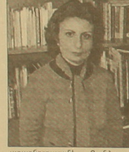
առաջնորդարանի «Գանձասար» օրաթերթից, որն այլ թերթ գոյություն չունի: Ամեն առավոտ ստանում են միմյանց Բեյրութի հայ մամուլը: Գոհունակությանս հետ մեկտեղ լրագրողները, որ հայաստանյան որո-

յասանի անկախությունը սկզբնապես համայն հայությանը ուսուցանելու համար, քայքայելով իրավիճակն այնպես փոխվեց, որ միայնակ լրագրողները մեր մեծ հավաստի: Սփյուռքում մեր գոյությունը լրագրողներին է հայրենիքի կենտրոնացումը, մինչդեռ այն, ինչ նկատվում է այսօր, այլ բան է հուշում: Երեւանում քաղաքային այսօր նկատվում են եվրոպան հիբեցող ռեսուրսներ, խանութներ, բայց երբ անձանոթ մեկին հարցնում են, թե ի՞նչ վիճակում է ապրում, հավաստի կարծիքով է ապրում, որովհետեւ հասկանում են, որ այդ շնորհակալները ամենի համար չեն, այլ ինչ թվով մարդկանց: - Տեղեկատվություն ստանալու իմաստով հայրենիքի հետ ունեցած կաղը բավարարել են համարում: - Անուշահ, անհամեմատ տեսա-