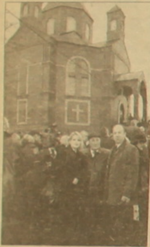
Սուրբ Խաչ սաճարի եւ Ցեղասպանության ու երկաւորի զոհերի հուշարձանի բացման արարողությունը Մամարայում

Ռուսաստանի զավառական ուժերը ֆաղափառ հայկական սաճարի կառուցմանը այսօր այլևս ոչ ոքի չեն զարմացնի: «ՈՏԻ կանգնելով» հայ գործարարներն սկսում են եկեղեցիներ կառուցել: Նրանցից յուրաքանչյուրն ունի իր բարձրագույնը: Բայց իրողությունն այն է, որ Հայաստանից մեկնելով, մեր հայրենակիցները բախվում են ոչ միայն արդեն հայտնի եւ բազմիցս նկարագրված դժվարություններին, այլև մեկ ուրիշ բարդության դա կնունի, հարսանիքի, հոգեհացի ժամա-