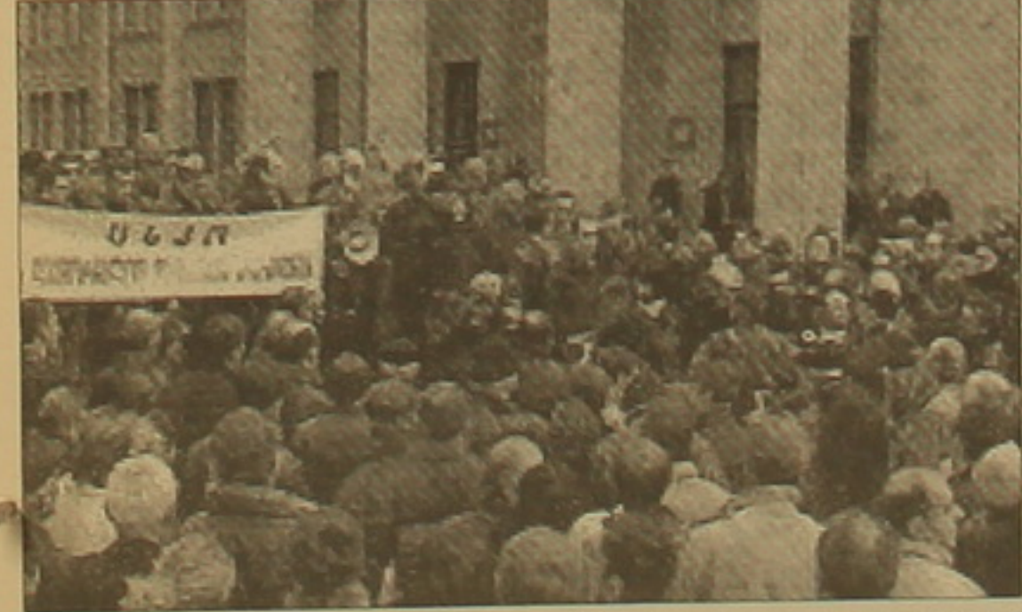
ժողովրդավարական չափանիշներին: Ըստ ԿԵԴ-ի վերջնական արդյունքների՝ նախագահ էր. Շեարդնաձեի «Հանուն նոր Վրաստանի» դաչիմն

ԹԱՅՏՈՒՆ ՆԱՐԵՆԵՆԱՆ ԹԻՐԻՍԻ Երկ երկույան Վրաստանի ԿԵԴ-ն վերջադեմ հրադարակեց նոյեմբերի 2-ին կայացած խորհրդարանական ընտրությունների արդյունքները: ԵԱԿԿ-ն, միջազգային մյուս կազմակերպություններ ընտրությունները որակել են կեղծված եւ անհամադասասխան