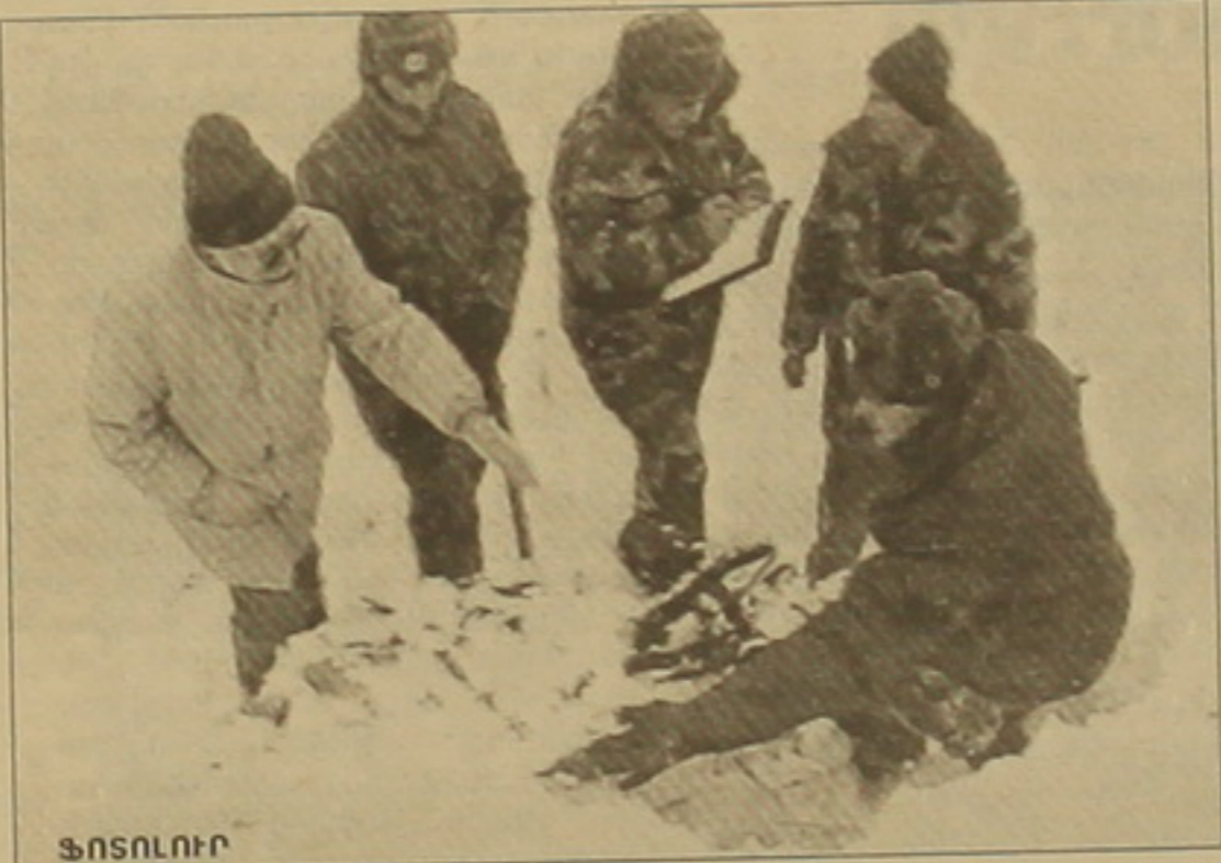
ՖՈՏՈՒՈՒՐ Մասնագետները զննում են «Միգ-29»-ի անկման տեղանքը:

Ռուսական «Միգ-29» ռազմական ինժեների վթարի հավանական դա- ճառը բախումն էր 2557 մ բարձու- րյան լեռանը: Այս մասին երեկ լրագ- ողներին հայտնեց դաշտանության Նախարար Սերժ Մարգարյանը: Նա ավե- լացրեց, որ ինժեները եւ օդային զս- վել են վթարի հաջորդ օրը, այսինքն՝ Ե- րեկ: Օդային ընկած է եղել ինժե- րից 30-40 մ հեռու: Ռուսասանի դաշտանության Նախարարությունից ժամանել են խմբեր, որոնք ղեկ է հե- տանկեն վթարի դաշտանները: Հայասանի դաշտանության Նա- խարարի կառավարության նիստին հաջորդած մամուլի ասուլիսին մա- նակցելու մյուս դաշտանը Ռուսական ռազմահանգրվանների կոմունալ վճարները Հայասանի բյուջեից կա- սարելու առնչությամբ դադարա- նումներ շարժել էր: Սերժ Մարգարյան անհասկանալի համարեց որոշ ուժե- րի Երևանում ընդհանուր առմամբ, նե- ղով, որ Հայասանն այդ դաշտանու- թյունն ստանձնել է 1996 թ. սեպ- տեմբերին կնքված դաշտանագրով: Նախարարը հավաստեց, որ Հայաս- անը վճարում է Ռուսական ռազմա- կայանների հոսանքի, ջրի եւ ջեռուց- ման վարձերը, որոնք կազմում են շա- րեկան 1,5 մլն դոլար: Մակայն դա փոխհատուցում է Ռուսական կողմի առաջարկած այլ ծառայությունների դիմաց, որոնցից նեղվեց միայն մեկը՝ հայ սպաների ուսուցումը Ռուսասա- նում: 1996 թ. նույն դաշտանագրով