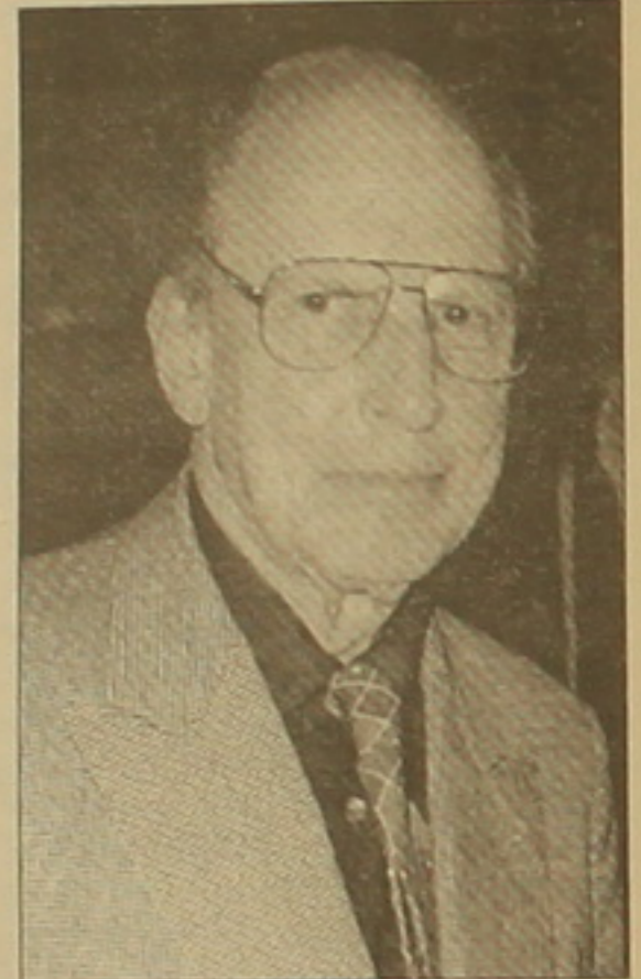
Տերի Մորգենթաու III-ը

«Թուրքիայի կառավարության հովանավորությամբ իրագործված այս ժողովրդի բնաջնջումը հաճախ անվանում են «ստոպգրված ցեղաստանություն»: Չեմաների կոստանդուպոլսյան վեցնական վճիռը կայացնելիս շիջվելու ասել է՝ «Ո՛վ է այսօր հիշում հայերի կոստոնջը»: Եվ իրոք, մոտ երեք քառորդ դար Յոնի Գեղաստանությունը մի կողմից մոռացված է եղել, մյուս կողմից՝ կասաղի հերված թուրք ոճագործների կողմից: Անգամ Մ. Անհանգենը թեքացել է ճանաչել», հոդվածի սկզբում գրում է նա: Այնուհետև Մորգենթաու ընդգծում է, որ Բալախյանի նոր գիրքը վկայակոչում է 19-րդ դարավերջի եւ 20-րդ դարի առաջին տասնամյակների ընթացքում հնչած աղաղակները, որոնցով հեղեղվել էր հայության կյանքը՝ վառելով գրաստության կրակներ: Իբրև օրինակ նա նշում է 1890 թվականին արյունոտ սուլթան Աբդուլ Համիդի հրամանով 200 հազար հայերի կոստոնջի մասին, որը սարսափ էր առաջացրել ողջ եվրոպայում: Մեծ Բրիտանիայի վարչապետ Վիլյամ Պիտերսոնը կասեցրեց իր արտաքին քաղաքականության ծրագրերը՝ չհամարձակվելով մարդկանց քուլտուրան հանձնարելու: 1894 թվականի նոյեմբերի 26-ին Բոսնոսում սեղի ունեցած համաժողովը, որի ժամանակ հնչած կրօն ճանաչումը ուղղված էին կանանց իրավունքների թափափուկությանը: Դրան հաջորդել է «Յոնի Գեղաստանի միացյալ ընկերներ» կազմակերպության գործունե աշխատանքը՝ նոր հիմնադրամներ ստեղծելու ու մարդկանց իմնագիտակցությունը բարձրացնելու համար: