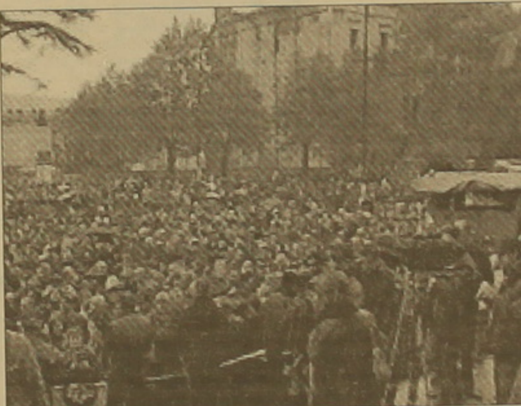
Վրաստանում ցույցերը շարունակվում են:

ԹԱՄԹՈՒ ՀԱՎԱՐՑՈՒՄ. Երկուսրորդ երկրյան Աբաչիձեի Ինքնավար Դաճարաբանության առաջնորդ Ասլան Աբաչիձեի անակնկալ այցով ժամանեց Երեւան, որտեղից ուղեւորվեց հարեւան հանրապետության մայրաքաղաք Բաքու: Ըստ լուսաբանական հաղորդագրությունների, որ սարածել են սարբեր լրատվական գործակալություններ, Աբաչիձեի Ռոբերտ Քոչարյանի հետ հանդիպման ընթացքում մեկնակցել է Վրաստանի ներքին գործերի նախարարին, ինչպես նաև հայ-վրացական երկկողմ կապերին առնչվող հարցեր: