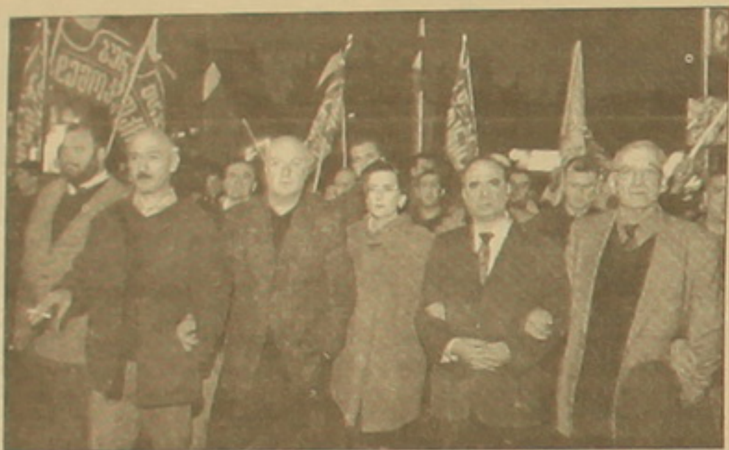
Ընդդիմությունը Շեարդնաձենից եւ ԿԸԳ-ից թափանցում է հրադարձվել ընտրությունների արդար արդյունքները, ինչը ԿԸԳ-ն չի անում: Խնդիրն այն է, որ ընտրություններից անցել է երեք օր, սակայն ԿԸԳ-ում հաշվել են ծայրերի միայն 70 տոկոսը: Տվյալներ չեն ստացվում Ազարիայից:

Ախոր էլ 1 Կառավարական ուժերը բարունակում են Երևանում մեծ թափել էղ. Շեարդնաձենի նստավայրը, ԿԸԳ-ն, ռազմավարական նշանակության օբյեկտները էղ. Շեարդնաձեն նախորդին ուժ Երևանի ղեկավար հեռուստատեսությամբ հայտարարեց. «Ինձ չի հետաքրքրում, թե ինչ է ասել այս կամ այն դիտողը: Կան ստառնալիներ, որ եթե մենք (որեւէ կուսակցություն) չստանան այս կամ այն տղու ծայրերը, ապա թափանցելու են կառավարության եւ Շեարդնաձենի հրաժարականը: Ես սովորեմ եմ հրաժարական տալու: Թող ոչ ոք ինձ դառնով չվախեցնի, բայց թող ղեկավար լինեմ, որ իշխանությունների դեմ ուժի կիրառման