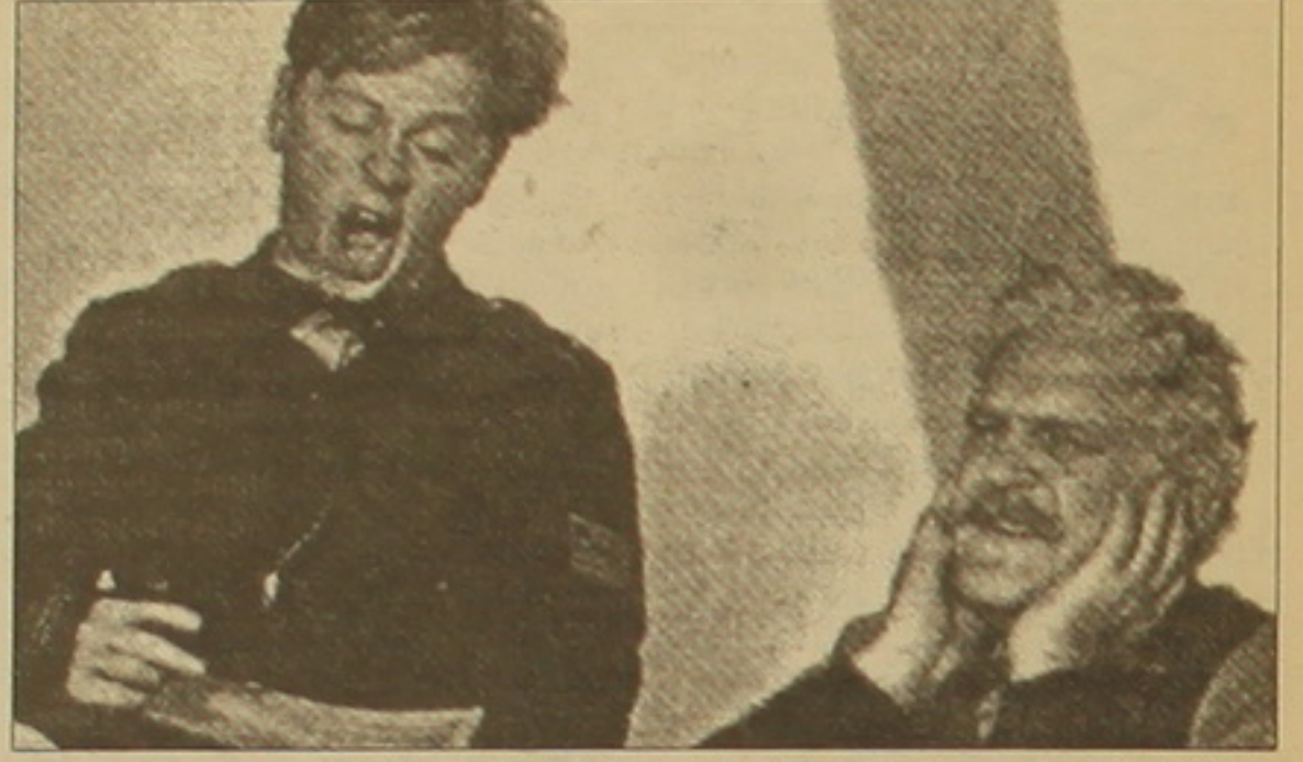
Միկի Բուսին (ձախից) «Եվ կյանքը շարունակվում է» ֆիլմում