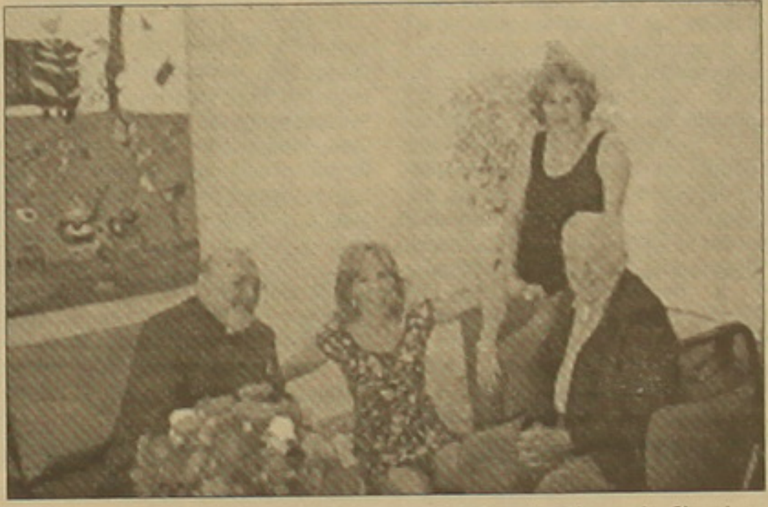
մորաբոջս, նա երկու դուստրերի, Բեանու կնոջ ու տատի հետ Ամերիկա գնացին 4 եղբայրներով: Մի կերթ ղանկվել էին աղջիկների մեջ»:

ղսնելու: Վանի բարբաղը հաղիվ է հիտում, մինչ դուստրերն ընղհանրաղես հայրենն ղեն ղոսում: