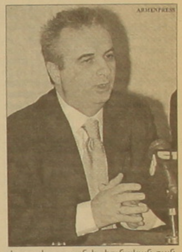
Կառավարության և հունական բանկի միջև:

«Անցյալում համագործակցել են, համագործակցում են և կհամագործակցեն», երկ լրագրողների հետ հանդիպման ժամանակ ասաց Հունաստանի փոխարտգործնախարար Յուրանի Մակրինիդիսը: Ըստ նրա, հարաբերությունները երկու դեպքում էլ գործարարների միջև լավ բարձր մակարդակի վրա են: