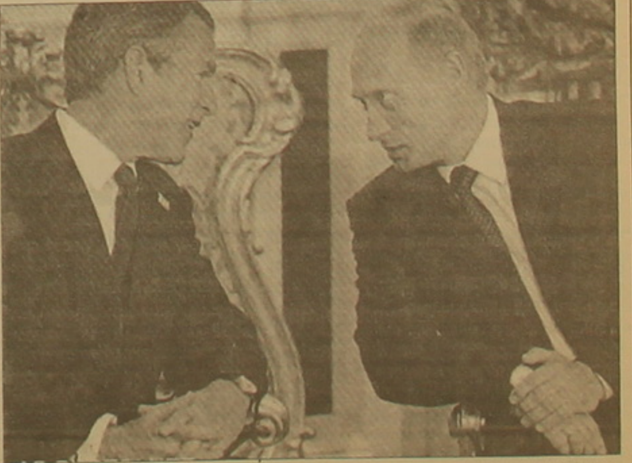
«Անկաշակնոր մթնոլորտ» Բուրի եւ Պուտինի միջեւ:

Պուտինը նեց է, որ զագաթաժողովի նիստերում Բուրը խոսել էր ոչ միայն ադախովագրության, այլեւ ճնշեստության մասին, մասնավորապես լավատարբն էր արտահայտել ԱՄՆ-ի ճնշեստության հեռանկարների մասին: