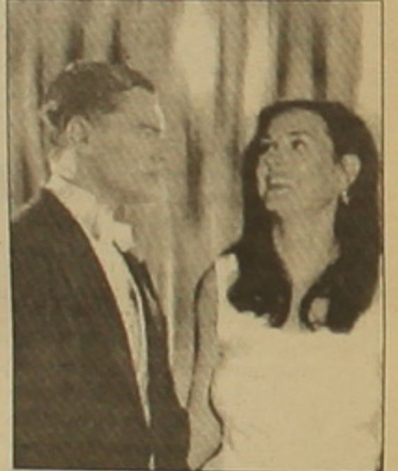
Գալ խնդրել էր 23-ամյա քաղաքացիական Գիգել Բանչենի ձեռքը, բայց մերժում էր ստացել: Դի Կապրիոյի ընկերուհի խոստերով, երբ դերասանը երրորդ անգամ է առաջարկություն արել, 23-ամյա մանեկեցուհին «ուսերը բոքվել է եւ համաձայնել»: Լեոնարդոն նրան հավաստություն տրեղում է սվել, Լաուրա, մեղք ասած, իդեալական վարագիծ չի ունեցել վերջին 3 տարիներին, երբ ախարհագրական առումով հեռու է եղել Գիգելից:

Այն րանից հետո, երբ Դեմի Մուրը դասնադես հայտարարեց, թե ամուսնանում է, Լեոնարդո դի Կապրիոյի ընկերուհին եւս ամուսնության համաձայնություն սվեց: «Փիլիսոփայ» հանդեսի սվայներով, Դեմի Մուրը կամուսնանա եկող տարի: Նրա ընտրվածը 25-ամյա դերասան Էթոն Քաքչերն է, որը նկարահանվել է «Որտե՞ր է իմ ավստրեյանը» եւ «Նորադարձներ» ֆիլմերում: