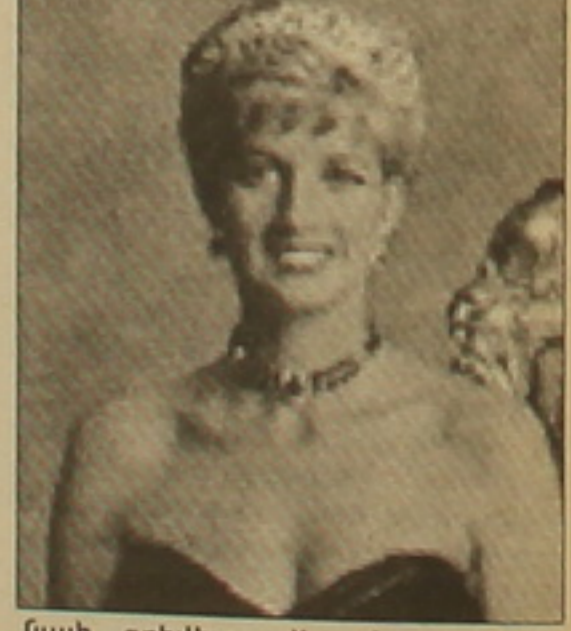
Մայի գողվելու վերաբերյալ: Բայց նրանց բոլոր խոսքերը հեռու էին ծածարությունից», ասում է Բարելը: Երկայրում նա քնակվում է ԱՄՆ-ում: Մեկ տարի առաջ հայրենիքում նրան ամուսնանեցին իգնականի ունեցված թողություն մեջ: Թագուհու միջամտությունից հետո Իրեանի գործը կարճեց: Բայց Բարելը ստիպված հեռացավ Մեծ Բրիտանիայից: Նախկին ծառայողները շուտով գիր է հրատարակելու: Նա խոստանում է այնքան ամբողջ ծածարությունը դասնել Մեծ Բրիտանիայի քաղաքական ընտանիքի անենասիդելի ներկայացուցչուհու ողբերգական մահվան վերաբերյալ:

Բրիտանական «Դեյլի միրոր» թերթը հրատարակել է 1997 թ. Փարիզում ավստրալիացի գողված իգնականի Դիանայի վերագրվող մի նամակ: BBC-ն հաղորդում է, որ Ուելսի իգնականի այդ նամակն իր ողբերգական մահից 10 ամիս առաջ ուղարկել է իր ծառայող Փոլ Բարելին, որը երկար ժամանակ եղել է նրա վստահյալ անձը: Նամակում իգնականին հայտնում է, թե գիտի իր դեմ նախատեսարանվող մահափորձի մասին: «Մարտությունները կխափանեն արգելակները եւ այդպիսով ավստրալացի կտարնեն», գրում է նա: Դրանում Դիանան մեղադրում է ամուսնուն՝ արհայազն Չառլզին: «Մահափորձը նախատեսարանվում է Չառլզի նոր ամուսնության համար ուղի հարթելու նպատակով», ընդգծում է նա: Երեւելու նաեւ մահափորձը իրականացնողի անունը, որը «Դեյլի միրոր», սակայն, չի հրատարակել: