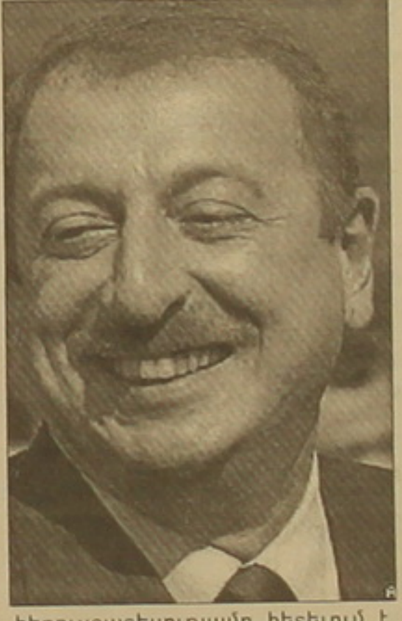
հեռուստատեսությամբ հետևում է Ադրբեջանի ներադախական գա- րագումներին», ասել է արդեն Ադր- բեջանի նոր նախագահ Իլիամ Ա- լիևը:

Ադրբեջանական դեպի հե- ռուսաստանությունը ցուցադրում է Բախվում սեղի ունեցած բռնու- թյունների այն կարգերը, որտեղ նախագահական ընտրություննե- րում դարձված էր համարի կողմնակիցները (ջարդարները ներկայացվում են որդես մուսա- վաթականներ) ջարդուփոշուր են անում խանութների ցուցափեղ- կերը, ավտոմեքենաները, ոստի- սակ սղանում ոստիկաններին: Հստակ նկատելի է, որ Ադրբեջա- նում փորձ է արվում ձեւավորել հասարակական կարծիք եւ ժո- ղովրդին համոզել, որ մուսավա- թականները փորձում են սաղա- լել մոտ 80 տոկոս վեբներ ստացած Իլիամ Ալիևին: