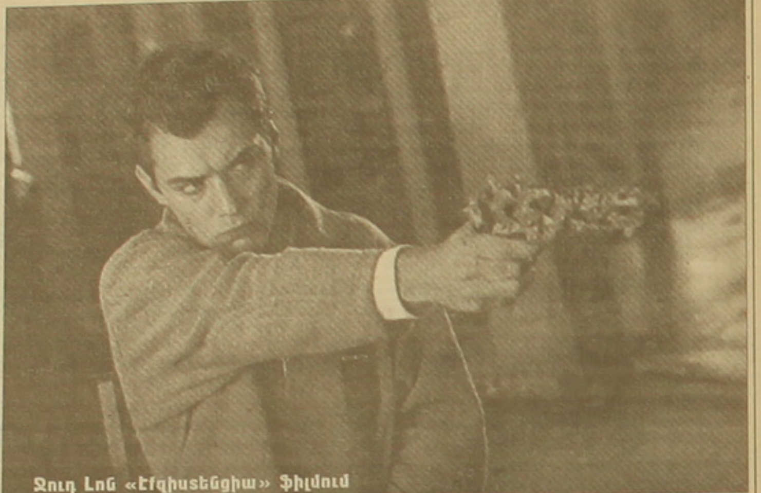
Ջուդ Լոն «Էֆգիստենցիա» ֆիլմում

Այս մոտիվները աշխարհի չափի հին են այսօր նորահայտ համարվելու համար: