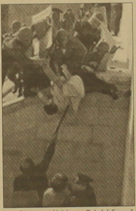
«Չեյդար Ալիևը Բիլվեյնոնում ինտերմենտով եւ ադրբեջանական

Նախկին խորհրդային արածոնում դիմաստիայի հաստատման իշխա- նությունը հորից որդուն փոխանցե- լու առաջին փորձը հաջող ընդ- նություն բռնեց: Ադրբեջանում մոտ երեք սասնամյակ իշխած Չեյդար Ալիևն իշխանությունը փոխանցեց նախ- ջեւանյան կլանի երեւելի դեմոկրատի- կ իր որդուն՝ խաղաղու իւ կնամուլի համբավ վայելող Իլիամ Ալիևին: «Իլիամ Ալիևն Ադրբեջանի նա- խագահական ընտրություններում ժողովրդի սիրելի թեկնածուն է», ընտրությունների օրը հայտարարել էր արդեն Ադրբեջանի առաջին սի- կին Սեհրիբան Ալիևան, հավելե- լով, որ «երեկոյան Ալիևների ընտ- անիքը նստել է Իլիամի հաղթանա- կը, ինչի մասին տեղեկացվելու է Չեյդար Ալիևին»: