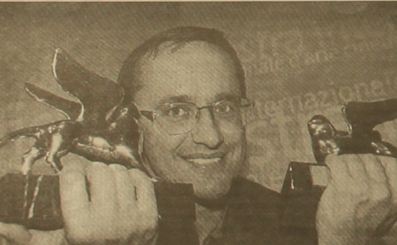
Անդրեյ Զվյագինցե իր «առյուծներով»

Վեներա 60-րդ միջազգային փառաստուն Անդրեյ Զվյագինցեի «Վերադարձ» ֆիլմի ընդհանուր գույք «Ռուկե առյուծները» լավագույն կինոնկարի եւ առաջին աշխատանքի համար, նորեղուկ ռեժիսորի անվան ռուբլը մեծ արժույթ են հանել: Ոչ մի ռուսական ֆիլմ Արեւմուտքում սման բողոքի չի առաջացրել: «Վերադարձը» Ֆրանսիայում էլրան կրթաբարձր միաժամանակ 60 կինոդասարաններում: Արեւմտյան Եվրոպայի բոլոր երկրները կամ արդեն զննել են, կամ էլ՝ ցանկություն հայտնել ձեռք բերելու ֆիլմը ցուցադրության համար: «Վերադարձը» մեծ հետաքրքրություն է արթնացրել նաեւ Ավստրալիայում, Ճապոնիայում, Լատինական Ամերիկայում եւ այլուր: Ամենխաղեղ հաջողությունը համաշխարհային կինոնկարում աղագահար ռուսներն արդեն որակել են «չեսնված հրաժե», թեեւ Զվյագինցեի հայրենակից կինոնկարահանողները տարակարծիք են ֆիլմի վերաբերյալ, ուր «երկարատես բաժանումից հետո չգիտես որտեղից լույս ընկած հայրը երկու որդիներին տանում է զբոսանքի, որն իրականում դիցաբանական ուղեւորություն է դեպի արիության ակունքները՝ ինչ-որ անմարդաբան կղզում զսնվող ինչ-որ արկղիկի ետեւից»: Ինչեւեւ, Վեներա 60-րդ միջազգային փառաստունի ծրագրում ընդգրկված «Վերադարձի» ցուցադրության բոլոր սեանսներին դառնալով այնքան լեզվեցում է եղել, որ նույնիսկ «Փարամաունթ», «Միւրմախ», «Սոնի Փիլիքսթրո» ամերիկյան նշանավոր կինոընկերությունների սեփականությունը թախտ չի վիճակվել ֆիլմը դիտելու: «Premier» հանդեսի թղթակից Ռոման Ալեքսանդրովից հաջողվել է մեկնել հոչակավոր դարձած Զվյագինցեի հետ հենց Թորոնթոյում էլ հարցազրույց ունենալ, որը մասնակի կրճատումներով ներկայացվում է սուրե: