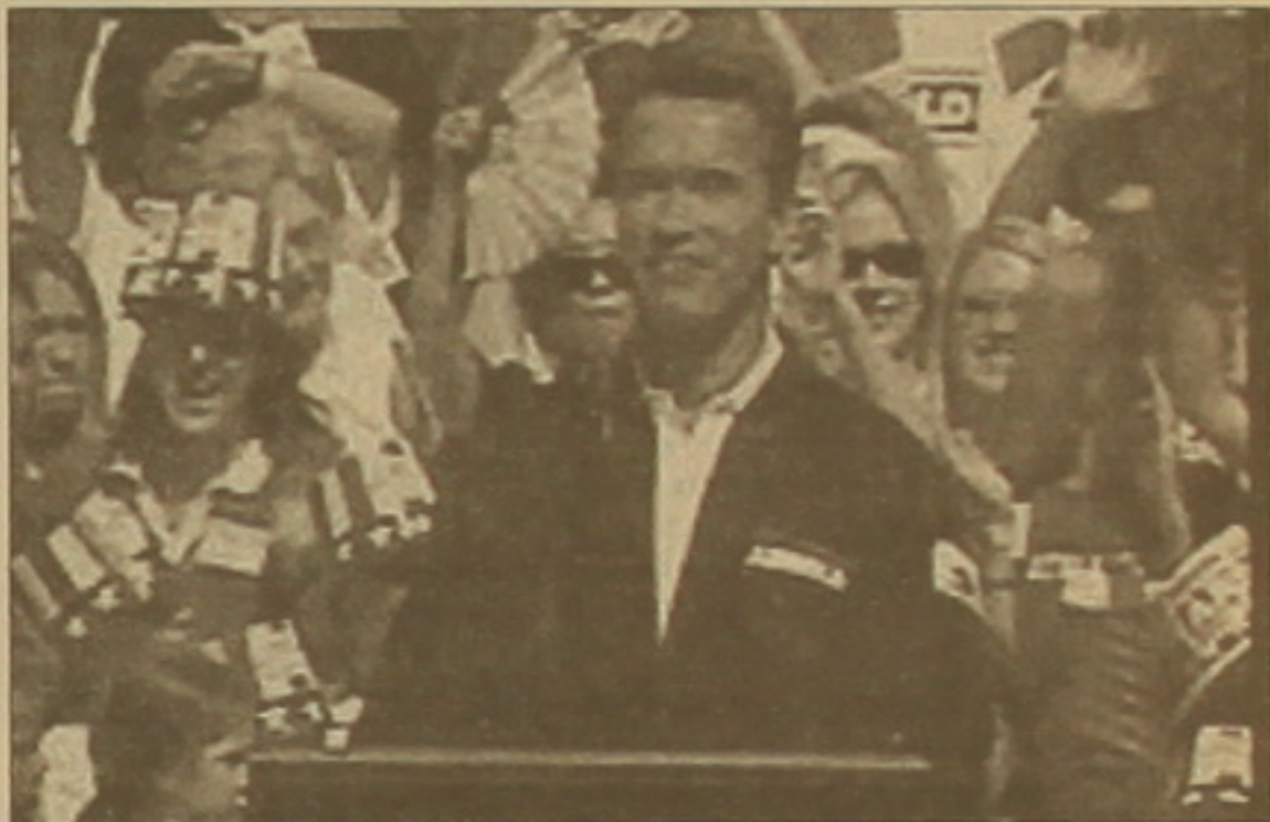
Անուղղ իր երկրագունդի հեռ:

առջև ելույթ ունենալով՝ 60-ամյա Գրեյ Դեյվիսն ընդունել է սեփական դաժանությունը և հայտնել, որ արդեն զանգահարել է Ըվարցնեցերին և ընտրվելու հարթակի առթիվ: Ֆրանսուա Կարտերը և, որ Ըվարցնեցերի հարթակին զգալի չափով նոյապես է Կալիֆոռնիայի մեկուկես միլիոնանոց ռուսական համայն-