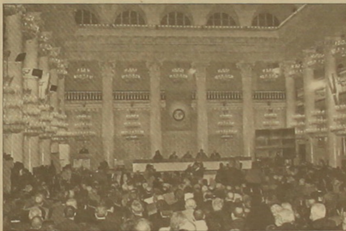
Մոսկվա. Մյուսնազարդ դահլիճ: Տեսարան համագումարից:

մոսկվայի խաղասենյակում, մյուսները (թերեւս լավագույնները) հավաքեցին նոր ու հոյակերտ կառույցում Մոսկվայի Երաժշտության ակադեմիայի ներկա լինեն Արամ Խաչատրյանի 100-ամյակին նվիրված համերգին: Նրանք զարմացրին Մոսկվայի սիմֆոնիկ նվագախմբի արտիստներին, ըստ չափի համաբաշխ ծափահարելով իրենց հանձարեղ հայրենակցի անմահ դասական ե-