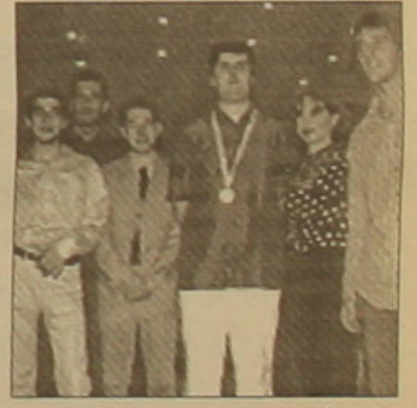
Մրցաւարի հաղթող ՆԱՕ թիւը:

Հունաստանի Կրեսե կղզում ավարտվեց Եախմասի Եվրոպայի ակումբային առաջնությունը: Ավարտական տուրում 4-2 հաւելով հաղթելով իսրայէական «Բեեր Շեւային», մրցաւարի հաղթող ճանաչվեց ֆրանսիական ՆԱՕ թիւը: 7 հանդիպումներից 6-ում ֆրանսիացիները հաղթեցին, մեկն ավարտեցին ոչ-ոքի՝ վասակելով 13 միավոր (ընդհանուր միավորների Բանակը՝ 30): 2-րդ տեղը գրավեց Վարսաւայի «Պուրնիս Մյուլը», որը հաղթեց «Լադայ-Կազան-1000»-ին (4-2): Վարսաւայի թիւը Միսկի «Կիսեյակի» հետ հավաքեց հաւասար՝ 12-ական միավոր, սակայն լրացուցիչ ցուցանիւներով գերազանցեց թեւաուսական թիւին: