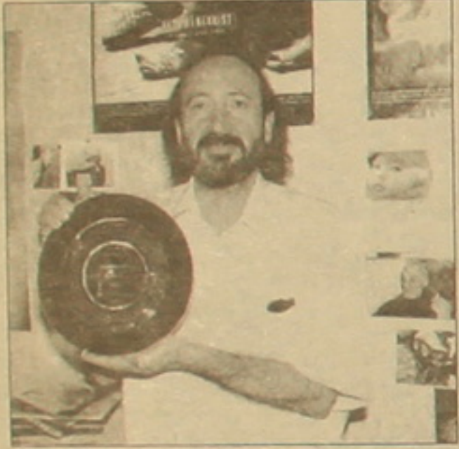
Հարություն խաչատրյանը իր մրցանակով

- Նյութի եւ ռեժիսորի միջեւ ծավալված դաշտում այդ հարցն էլ էր օրակարգի խնդիր. արդյոք նյութը, ֆիլմը բան հոտեստական չէ՞: Բայց Հարությունը, վերջիվերջո, ընտրեց այս տարբերակը՝ անգամ երկուդեղծով դրանից, որովհետեւ հասկացավ, որ ինքը՝ նյութն է թելադրում դա, ստիպում այդ կողմը գնալ, եթե չես ուզում ստել: Հիմա նյութին կողմից, ոչ թե ներսից նայելիս դիտելի ասես, որ բոլոր ծանր տեսարանների հետ մեկտեղ ֆիլմում կա նաեւ դաշտառություն բերող մի բան. դա հեղինակների, առաջին հերթին, ռեժիսորի եւ օմեքրասորի սերն է այն մարդկանց հանդեպ, ում ցույց են տալիս: Ցավի զգացում կա, ուրեմն ե՛ս՝ սեր, դաշտառություն, հետեւաբար չի կարելի համարել, որ միայն սեր կողմերն են միտումնավոր ցուցադրված: Եվ հետո՝ մենք մոռանում ենք վերջին յոթ-ութ տարիների մեր գլխով անցած դարձածը, իսկ այդ ամենը բնավ էլ անհետ չի անցել, որքան էլ կյանքը փոխվել է: Հարցեր կան, որոնք լուծումը ես դեռ չեմ տեսնում, մասնավորապես, երեխաների հետ կապված խնդիրները: Այն էլ ասես, որ ֆիլմում ռեալիզմը հարցերը միայն մեր խնդիրները չեն, համարձակային են, դրա համար էլ մյուսները կորեացուց մինչեւ արգենտինացի, սրին մոտ են ընդունում այն, ինչի մասին դասում է «Վավերագրողը»: Ես համոզված եմ, որ ֆիլմն իր դերը կատարեց եւ դեռ կկատարի, որովհետեւ Հարություն խաչատրյանի կարգի ռեժիսորը վերադարձավ կինո, միանգամից՝ միջազգային աստղաբազ, որտեղ եւ կար սաղ տարի առաջ, ասեմ, թեկուզ «Վերադարձ ավելյաց երկիր» ֆիլմով, իսկ հիմա նա վերադարձել է ավելի հասունացած, հայացքի մեջ աղբյուր սարիները դառնությունը կա եւ այդ դառնությունից եկող իմաստությունը: