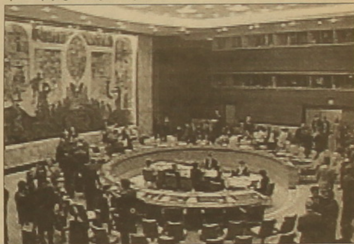
ՄԱԿ-ի Անանի հայտարարել է, թե նախագիծը «ՄԱԿ-ին թույլ չի տալիս որևէ դեռ խաղալ» Իրաֆում:

Կոֆի Անանի դիրքորոշումը, մեկնաբանների կարծիքով, կարող է ազդել Անվանագույրյան խորհրդի ոչ մեծական անդամների սրամադրությունների վրա եւ ծախսողել ամերի-