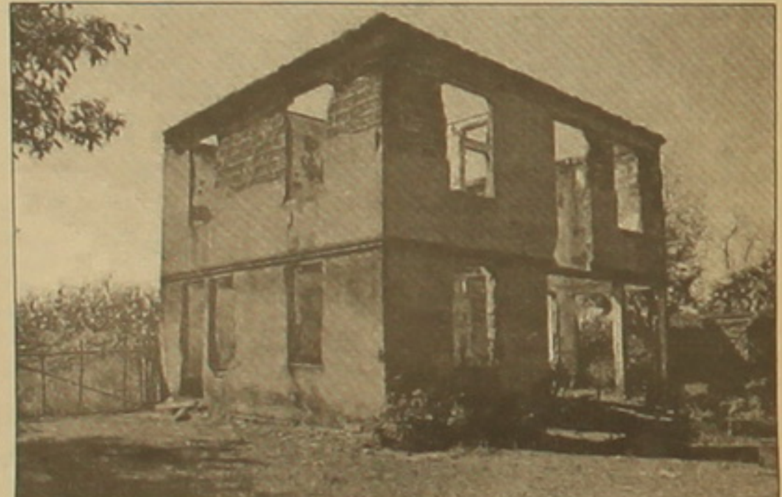
Քանդած օջախ Լաբրայում:

Գյուղացիները մասնում են, թե ինչո՞ւ են մի օր զվարդիակները մարդկանց փոս փորել են տալիս, ապա կանանց եւ երեխաներին ստիպում իջնել փոսի մեջ, իսկ տղամարդկանց՝ ծածկել փոսը: Վրացի զվարդիակներն ա-