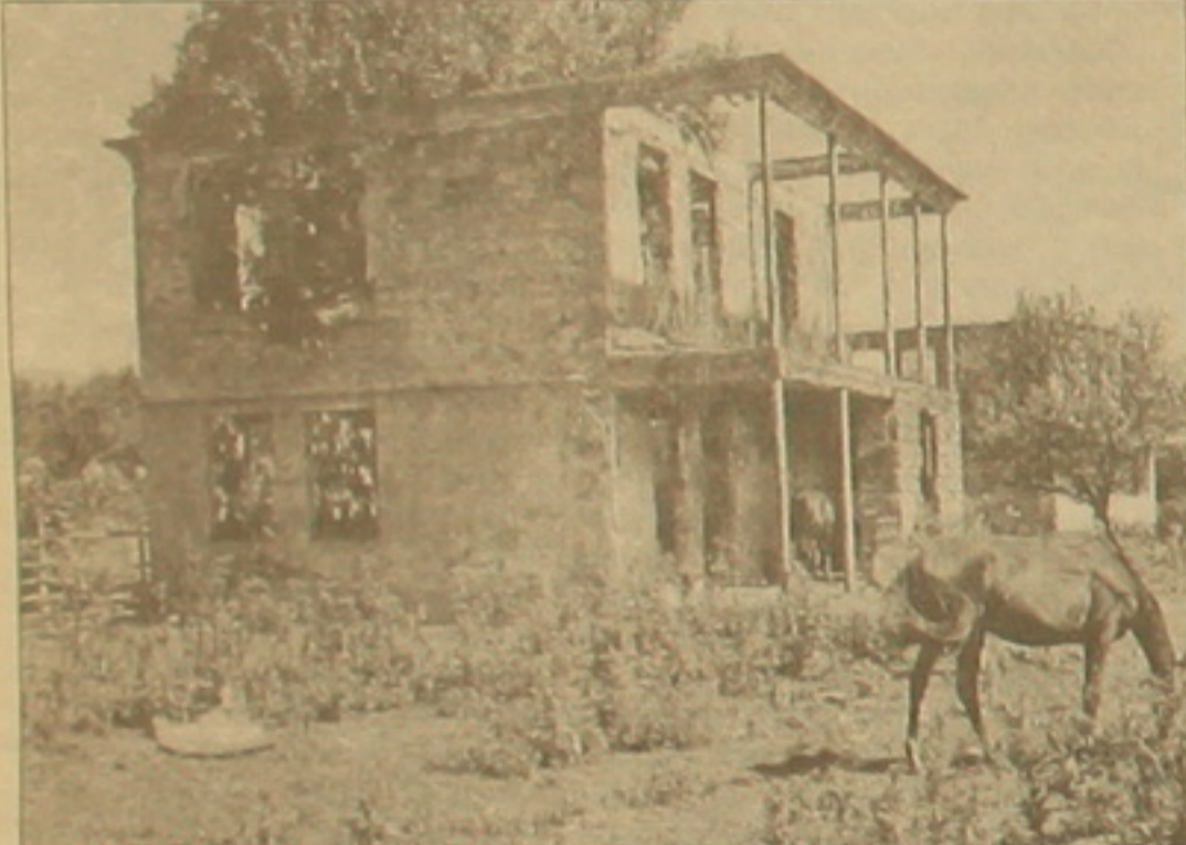
Հայի լված տուն

Վրացական «Տրիբունա» քերթը գրում է, թե Արխազիայի դաճադանի ժամանակ հայերից կազմված «Բաղամյանի գումարակներ» իրականացրել է վրաց ժողովրդի ցեղասպանություն: Այս օրերին Սուխումում նույն են վրացիների դեմ տարած հաղթանակի 10-րդ տարեդարձը. 1993 թ. սեպտեմբերի 27-ին Սուխումը, իսկ սեպտեմբերի 30-ին ամբողջ Արխազիայի տարածքն անցավ արխազական զինված ուժերի վերահսկողության տակ: «Ազգի» սեպտեմբերի 24-ի համարում ներկայացրել էին Արխազիայի դաճադանի «հայկական շեքադուրայան» վրացական շեքակները: Այսօրվա թղթակցությունը ինքուրի գեղի աջ ակից է: Չագրայում, Սուխումում, Գուլրիժի քաղաքում հանդիպեցին մեծ ու մեծ հայերի, այդ թվում «Բաղամյանի գումարակներ» մարտիկներ: