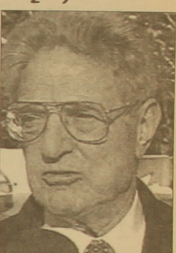
Վրա, որտեղ որոշվում է աշխարհի աղազանը»: «Կոմերսանտ» քերթը հիշեցնում է, որ ավելի վաղ Սորոսը որոշել էր մասնակցել 2004 թ. նախագահական ընտրություններում Բուժի դարձությանն ուղղված արձակվելու եւ դեմոկրատ ընդդիմության ֆինանսավորմանը հասկացնել 10 մլն դոլար:

ԱՄՆ նախագահ Չորջ Բուժի վարչակազմի ֆաղափականությունն «ավերգիա է առաջացնում» մյուս երկրներում, ինչպես նաեւ կասկածի Եահերում ամերիկյան արժեքներն աշխարհում եւ ԱՄՆ-ի գերիշխող դերը: Այդ մասին հայտարարել է ամերիկացի հայտնի միլիարդատեր, «Բաց հասարակություն» ֆունդի հիմնադիր Չորջ Սորոսը ԱՄՆ Պետքեդարձանների աջակցությամբ կազմակերպված հանդիպման ժամանակ: Սորոսի կարծիքով, Բուժի վարչակազմի ֆաղափականությունը բաղկացած է երկու հիմնական կետից: Առաջին, ԱՄՆ-ը լիք է բոլոր ջանքերը գործարդի աշխարհում իր ազդեցությունը դաւադրելու համար: Երկրորդ, ԱՄՆ-ն իրավունք ունի հասցնելու կանխիկ հարվածներ: Ամերիկացի ներկայիս ֆաղափական դեկալաներին Սորոսն անվանում է «գերազանցության գաղափարախոսության ֆաղափար»: «Նրանց Եահերները հիմնվում են գլխավորապես այն դրույթի վրա, քե միջազգային հարաբերություններն ուժի հարաբերություններ են, որը կառավարում է միջազգային իրավունքը», հայտարարել է նա: Վերջերս Սորոսը որոշել է իր գործունեությունը «կենտրոնացնել ԱՄՆ-ի