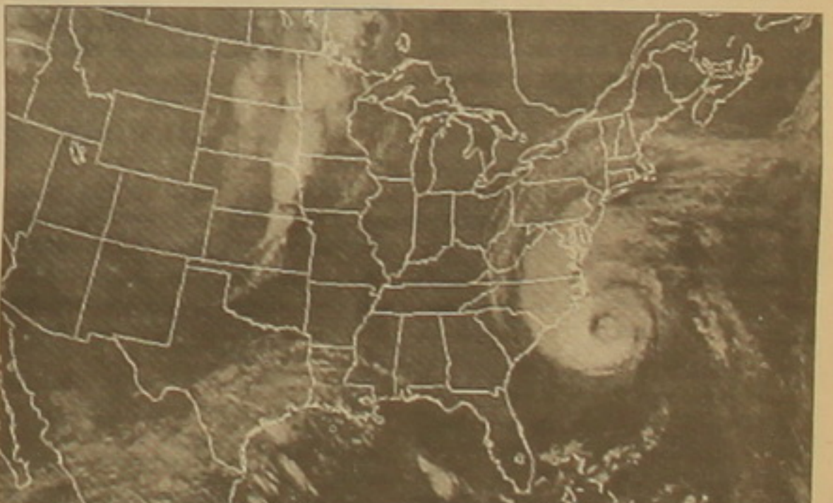
բել» փորոքի մոտենալու հետ:

դորոցներ կարող են օգտագործվել որտեւ փորոքից սուժողներին օգնություն ցույց տալու վայրեր: ԱՄՆ եղանակի ազգային ծառայության սվայներով, «Իգաբել» փորոքի եղիկներում ամուսնացությունը հասնում է ժամում 175 կիլոմետրի (վայրկյանում 49 մետր): Փորոքիկն իր