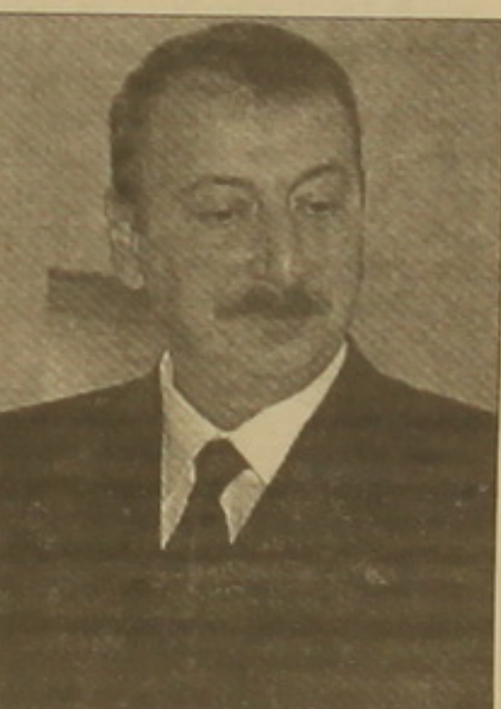
դասաղարկված է: Այս խոստովանությունը հաղիվ քե բիլի ընդդիմության ուժի նկատմամբ քեւահաղանությունից: Ուրեմն, ողայմանաղորված է Իլիամին Վաչինգսոնից ցուղաղբեղած ֆաղաղական աղակցության գիհակցությամբ, որն Աղիզաղեղին հուսահաղության է հասցնում:

Սեղանքերի 17-ի համարում «Ազգն» անղրաղանաղով այցելություններին, նեւել էր, որ Իլիամ Ալիեւն ԱՄԿարայում ընտրությունների աղնուղայամբ հայցել է Թուրքիայի ղեկավարության աղակցությունը: Մա հիմն սվեց եղաղորելու, որ նրան աղակցում է դաստնական Վաչինգսոնը: Աղաղեւ ընտրություններում նաղաղեւս «Մուսավաթ» կուսակցության նաղաղաղի Իսաղարին աղակցող ԱՄԿարան հրաձարվելով նրանից, աղակցություն չէր խոստանա Իլիամ Ալիեւին: