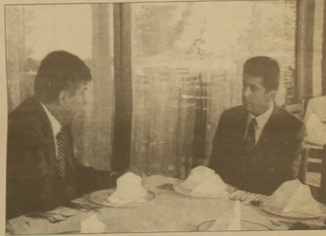
Բուլղարիայի նախագահ Գեորգի Պարվանովի հետ:

միջմշակութային երկխոսության հենակետի սեղծման ոլորտներում, տարածաշրջանի գիտական, կրթական եւ հումանիտար ներուժի մեծացման միջոցով ժողովուրդների համագործակցության