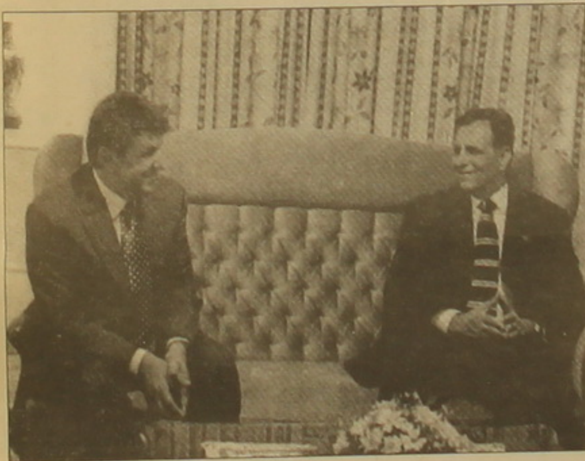
Մակեդոնիայի նախագահ Բորիս Տրայկովսկու հետ:

ՅՈՒՆԵՍԿՕ-ն Հարավարելյան եվրոդան իր աշխատանքի գերակայություն է ընսրել ոչ միայն մշակութային ու ֆաղափառությունների համաշխարհային խաչմերուկներից մեկը լինելու, այլեւ այն դասձառով, որ հենց