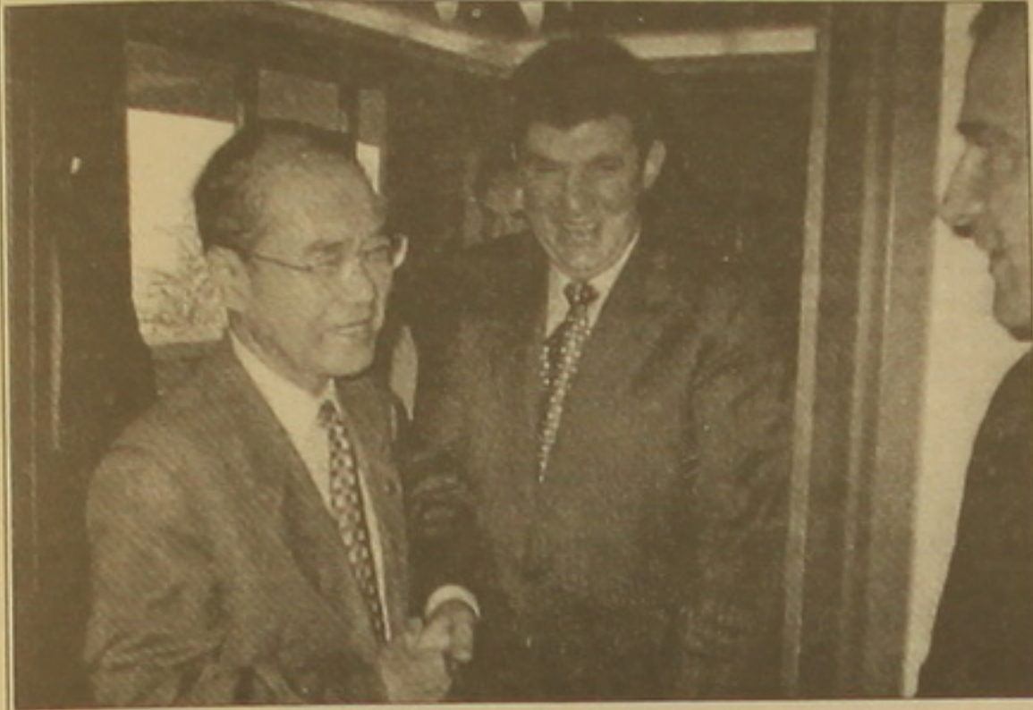
ՅՈՒՆԵՍԿՕ-ի գլխավոր ֆարսուղար Կ. Մացուուրայի հետ: