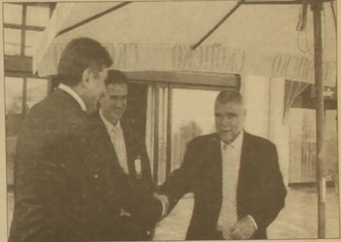
Խորվաթիայի նախագահ Ստեֆան Մեւիչի հետ:

Այդ նդասակով նա առաջարկեց երկրների, ՅՈՒՆԵՍԿՕ-ի եւ բարի կամփի դեսդանների միջես սեղծել սվյալ խնդիրներին առնչվող փոխգործողության հսակ մեխանիզմ եւ նեցը ընդհանուր խորհրդաժողովի 32-րդ նսաջրանի նախօրեին այդ բնազավառում ՅՈՒՆԵՍԿՕ-ի ֆարսուղարության եւ ՅՈՒՆԵՍԿՕ-ին առընթեր Ռուսաստանի մշակական ներկայացուցչության ձեռնարկած մի շարք համասեղ ֆայլերի կարեւորությունը: