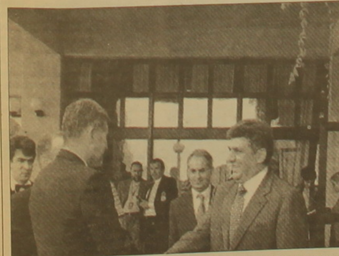
Բոսնիա-Հերցեգովինայի նախագահ Պրազն Զոլիչի հետ:

այստեղ է ձեղում ակնկալվում համամարդկային, էթնիկական արժեքների դասդանության,