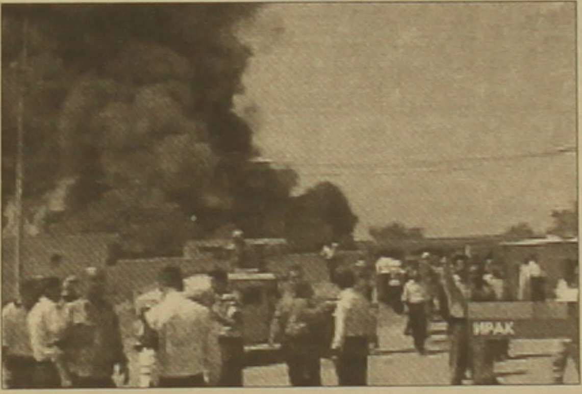
Մրանց համարում է Իրաֆի մասնամասն ստառնալի:

Արաբները, մասամբ նաեւ Իրաֆը, բնակչության հիմնական սարերն են: Արաբների մեջ կան սուլունիներ եւ շահեր: Սուլունիները, որոնք Սաղաթ Զուլեյխի գլխավոր հեռարանն էին,