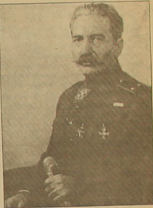
հաճույքին բողոքեցին կիլիկիահայությունը:

1919 թ. ապրիլին գործված, կազմաբերված իր գործառն, զենքերը հանձնելով Ամենայն հայոց կաթողիկոսին, անցավ արսասահման: Լինելով եվրոպական երկրներում, Անդրանիկը վերստին ձգտում էր կազմավորել նոր ուժեր, մտնել Կիլիկիա եւ վերականգնել հայոց ժողովրդի արտաքին կառավարողներն այս անգամ եւս բախի մահ: