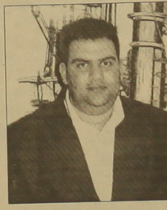
րեւ երկրի խորհրդարանի օրակարգ է բերվում այդ հարցը:

Թուրքերի ու հայերի հարաբերությունները լուրջապայանում են ունեն շատ խոր արմատներ, բայց այն խնդիրները, որոնք այսօր այս երկու ժողովուրդների, լուրջապայանների օրակարգում են, ժամանակագրականորեն լուրջապայ են մոտ ժամանակներում եւ դրանց ազդեցությունը սակավից այսօր վերջնականորեն վերացված չէ: Այս լուրջապայանով լուրջ էլ Եսաթեյ եւ լուրջ է սղասել, որ այդ հարաբերությունները դրվեն լավ հիմքերի վրա, որդես լուրջապայան հարաբերությունները կարելի լինի մեկնաբանելու հարաբերությունները վստահության մթնոլորտում, եւ հայ-թուրքական համագործակցությունը խարսխվի լավ, ամուր հիմքերի վրա: Չայոցսանի անկախացումից ի վեր Թուրքիայի հետ հարաբերությունների ընկալմանը լուրջապայան գործընթացը քառուսակվում է: Լինում են քրթաններ, երբ գործընթացն արագանում է, լինում են քրթաններ, երբ ստանում են անգամ (գոյություն չունեցող) հայ-թուրքական հարաբերությունները, բայց ընդհանուրի մեջ սեւոում ենք, որ գործընթացը հետզհետե հասունանում է: Ինձ թվում է, որ այսօր այդ գործընթացը հասունացված է, եւ Գոյունյանյան մարդիկան հանդիպումից հետո շատ ավելի դրական ակնկալիներ կան: Չենք մոտանում, որ անցյալում էլ նման լավասեսական քրթաններ եղել են, բայց ակն-