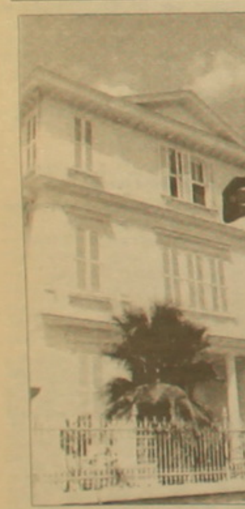
Պոլիս Հայոց լիարժեքները

Մեր քերի մարտի 19-ի համարում Եթովպիայի հայկական համայնքի մասնագիտությունների մասին տղազրված Սարգիս Ավագյանի հողավաճառն է անդրադառնում Աղիս Աբրահամ ձեռակալ, բայց արդեն 28 տարի Մ. Նահանգներում և աղա Կանադայում (Վանկուվեր) բնակվող, Հարվարդի իրավաբանական ֆակուլտետի շրջանավարտ, նույն համալսարանի Բեռնեդու անվան կառավարման քաժնից մագիստրոսի ասիճան ստացած, հակամարտությունների կարգավորման գծով մասնագետ Կարմիս Բորհանյանի խմբագրությանը հասցեագրված անգլերեն ընդարձակ հողավաճառ, որից բարգ-մամբար ներկայացնում են հետևյալ տեղեկությունները: