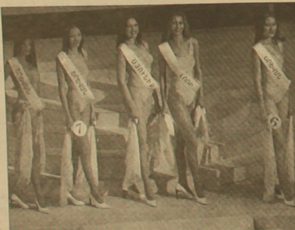
2-րդ փուլի գեղեցկուհիները ներկայացան լողազբեսներով: