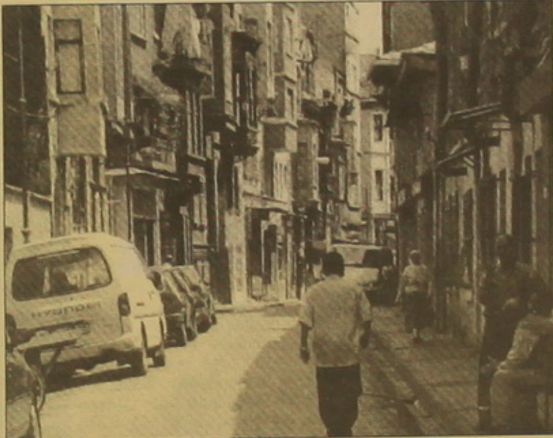
Գում Գափուր քաղաքի այս փողոցում կրակի օրերին հայեր վաճառում են Հայաստանի արտադրության աղբյուրներ:

«Չէ, միայն հայ մեծերի համար չեն դադար տասրասում: Սամբուրը մեծ քաղաք է, լինում են դժբախտ տասահարներ, և երբեմն անհրաժեշտություն է լինում Իրսոնյա վրացու, սեւամորթի համար