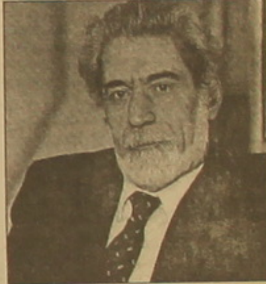
հայտնի է, եկեղեցու այս առաջարկները բավարարվել են: ՏԻ Ե 4

- Եկեղեցու դիրքորոշումը կոնկրետ ձևով արտահայտվում է, կարելի է կոնկրետիսային համարել: Մի՞թե սա միայն ֆաղաֆաղներին, մեծի թվի կամ Երուսաղեմի հարց է: - Հայ եկեղեցին, մասնավորապես, նեյ է անհատի անվանը համազոր թվի կիրառման անթույլատրելիությունը, առաջարկել է օրենքի վերաբերյալ և ողջ սեփական «անհասկանալի ծածկագիր» հասկացությունը փոխարինել «սոցալալական աղափարության ֆաղ» բառակապակցությամբ, հստակ է ստառիլ թվարկել համակարգի կիրառման ոլորտները, բացառել ֆաղաֆաղ անհասկանալի սլալների կուսակցություն մեկ տեղում, համակարգի գործարարական ընթացում բացառել հակաֆաղափարական խորհրդարանությունը (սիմվոլիկան): Ինչպես արդեն