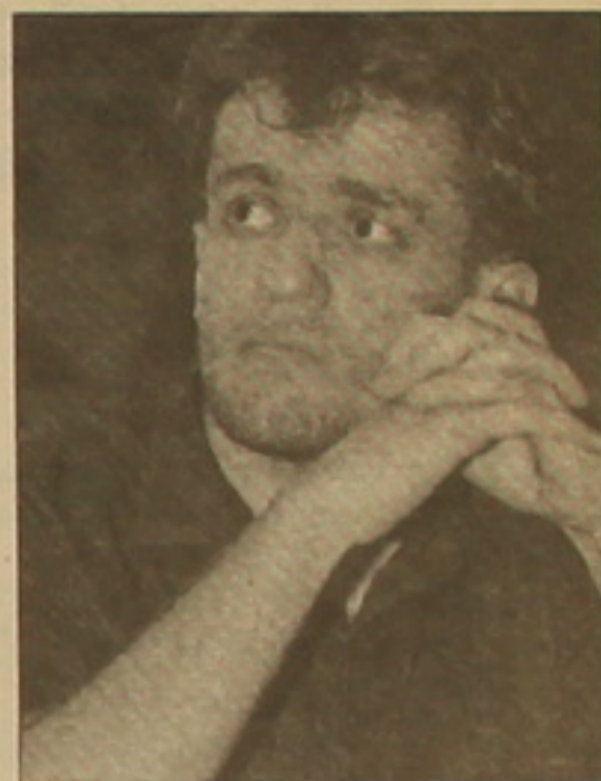
մայստերը մեկ անգամ եւս հաստատեց իր բարձր կարգը:

Գերմանիայի Մայն ֆաղաֆում անցկացվեց Լեւոնյանի մրցակցային մրցաշարի 11-րդ օրը: Գերմանացի մրցակցային մրցաշարի 11-րդ օրը: Գերմանացի մրցակցային մրցաշարի 11-րդ օրը: Գերմանացի մրցակցային մրցաշարի 11-րդ օրը: