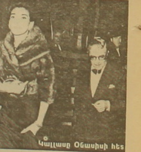
Կալլասը Օնասիսի հետ

Բացառված չէ, որ առաջիկայում Մարիա Կալլասը վերսին հայտնի էկրանին: Նրա հայրենակիցը՝ ծագումով հույն ռեժիսոր Կոստա-Գավրասը, վա-