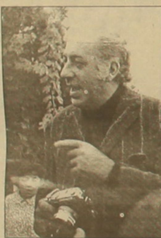
- Այդ ցրանում հնարավոր չեղավ հայության համար օգտակար բայլ անել, թեկուր եւ փեսայի օգնությամբ, անկարելի էր: