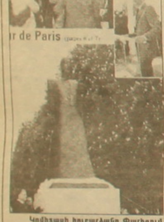
Կոմիսարի հուշարձանը Փարիզում

հեթաբային են իրեն: Միմասի արվեստի մեջ սեղել է ջերմություն, վերելք, Քոչարի արվեստի մեջ՝ հզորություն: Երեւանցին դասնեց, թե ինչպես մի անգամ Ազնավուրի հեթ զուրեցիլի եղիչն ասել է, որ իր հաջողությունը բնասուր օժտվածության շնորհիվ չէ միայն, վճռորոշ դեր են ունեցել սեփական նախաձեռնությունները: Երեւանցին էլ նախաձեռնող է եղել, բազում դժվարություններ հաղթահարելով հեթաբային է առաջացրել իր նախագծերի նկատմամբ: Փարիզում նա ծանոթացել է Փարաջանովի հեթ, նրան հաճախ են հանդիմել, ժամանակ անցկացրել միասին: Նույնիսկ ամառային մեջ Վարդապետ մի հե-