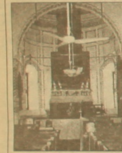
Դառայի հայկական եկեղեցին

Էկզոտիկ մի երկիր, XXI դարի բաղաճակրությունից ասես հազարամյակներով կտրված, 250 հազարանոց Բանգլադեշի բնակավայր բոլորակված գյուղերով: