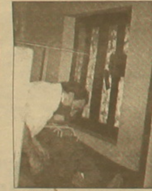
Թժիպ Սարգիս Ավագյանը հիվանդ երեխային զննելիս

Հայաստանի երկու թժիպներն ապրում էին Բանգլադեշի կոչվող բնակավայրում «Ռոթարի ինսերնեյն» դասկանող հաստատությունում, որի առաջին հարկում բուժական կենտրոն էր տեղակայված, իսկ վերելում հյուրանոցային հարկաբաժինը: «Ռոթարի ինսերնեյն» բարեգործական առաքելությամբ կազմակերպություն է, որի կենտրոնա-