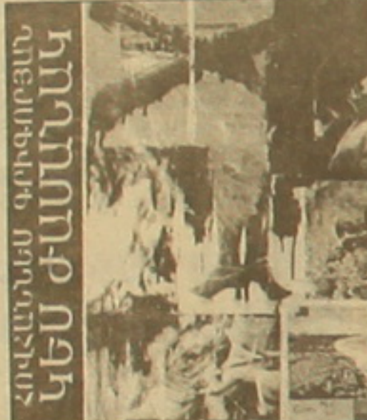
Հովերի արվեստը Կասեթի ժամանակ

Ժամանակը բանաստեղծությունների նոր ժողովածուն («Նոր դար», հրատ. 2002 թ.) մեր ժամանակների խրոնիկան է, ակնհայտ հայացք հայկական թատերական այս նոր բնորոշությանն ուղղված: Ներկայացում ազատությունների օճով, որոնք անկախության հետեւում: Իրեն բնորոշ կիսահեղձական երանգով, երբեմն ոչնչացնող ծաղրով, ավելի քան արհամարհական, ու նաեւ անփութ-անարար կեցվածով: Սարկազմով նկարագրվող երեւոյթներ կյանքին իրեն խաղ, իրեն երազ ստող վերաբերումով: