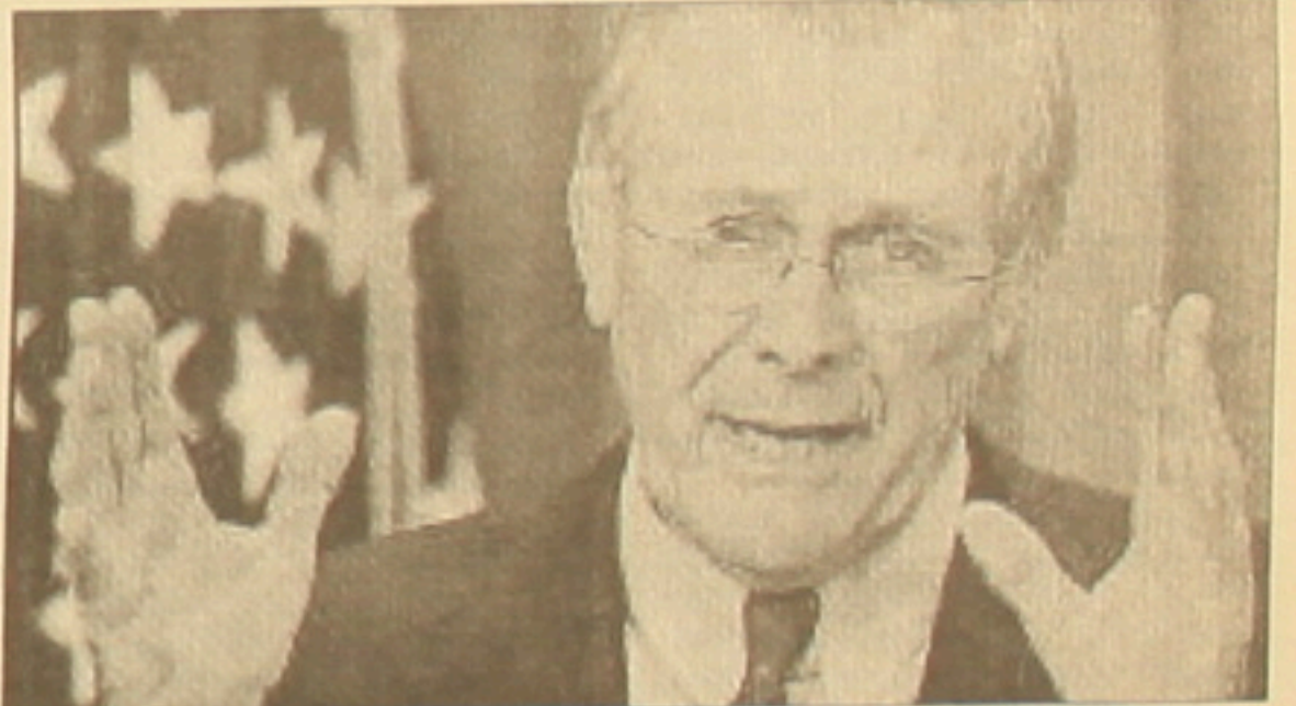
Մարտին Գոնալը Ռամսֆելդը 4-րդ փուլում դաշտայինում է «ձեռնարկային»:

Անցյալում ՆԱՏՕ-ի դեպարտմենտը Գոնալը Ռամսֆելդը մասնա-