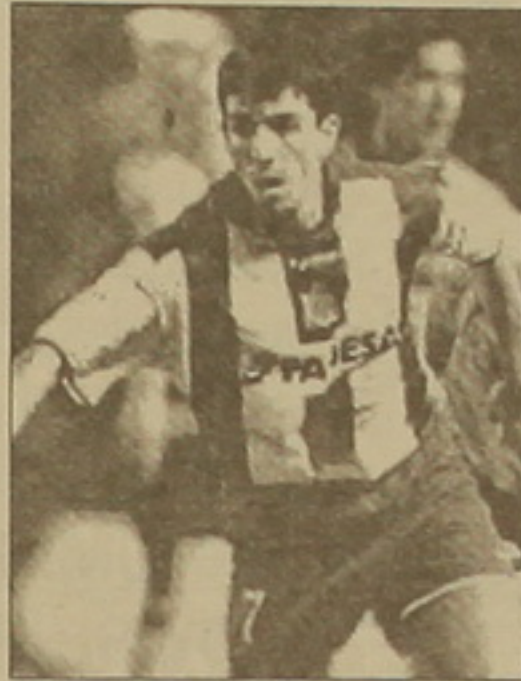
առաջնության 2 գործակցի: Իսկ ահա սերբ Մաթեյա Կեթմանը, որը Մաֆայից 6 զնդակ ավելի էր խիստ, գրավեց ընդամենը 2-րդ տեղը, քանի որ Գոլանդիայի առաջնության գործակցող 1,5 է: Մրցաշրջանի ընթացքում «Ոսկե խաղակոչիկ» համար

Իտալական «Դեյոթիվո» թիմի հոլանդացի հարձակող Ռոյ Մաֆայը ճանաչվել է 2002/03 թթ. մրցաշրջանի եվրոպայի լավագույն ռմբարկու: Նրան կիսմեծի մարզական հրահանգությունների եվրոպական ընկերակցության սահմանած «Ոսկե խաղակոչիկ» մրցանակը: Ֆուտբոլային մրցումներ, անուստ, հիշում են, որ ժամանակին նման մրցանակ էր հանձնում «Ֆրանս ֆուտբոլ» շաբաթաթերթը: Սակայն ասիական մրցանակի հեղինակությունը սասանվեց, քանի որ ԵԱՍԿ-ում սարքեր, ոչ առաջատար ֆուտբոլային երկրների ռմբարկուներն սկսեցին իրենց գույրի թիվն ավելացնել լայնամասշտաբով խաղերում խիստ զնդակների հաշվին ոչ արժանիորեն դառնալով մրցանակի դափնեկիր: Ուստի 1992 թ. «Ֆրանս ֆուտբոլ» դադարեցրեց մրցանակի խաղարկումը: Վերջին տարիներին «Ոսկե խաղակոչիկ» մրցանակը խաղարկում է մարզական հրահանգությունների եվրոպական ընկերակցությունը, որի կազմի մեջ մտնում են եվրոպայի մարզական հայտնի թերթերի ներկայացուցիչները: Որոշագի խուսափեն վերը նշված անարդարություններից, մրցանակի տեղը որոշվում է ոչ թե խիստ զուրկի ֆանտիկով, այլ միավորներով: Յուրաքանչյուր ֆուտբոլիստի խիստ զուրկը բազմապատկվում են սվյալ երկրի առաջնության համար սահմանված գործակցով եւ ստացված արդյունքով էլ որոշվում են լավագույնները: Նեւեմ, որ եվրոպական երկրների առաջնություններն ըստ իրենց խաղամակարդակների բաժանվել են 3 խմբի: Իտալական, Իսպանական, Ֆրանսիական, Անգլիական եւ Գերմանական առաջնությունների համար սահմանվել է 2 գործակցող, միջին մակարդակի առաջնությունների գործակցող 1,5 է, մնացած երկրներինը՝ 1: