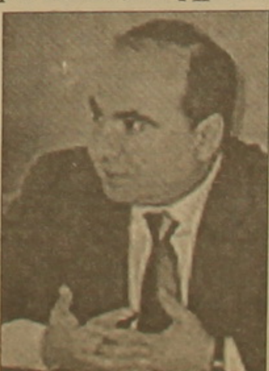
ում են երկրի համար ձակազարկված:

Արդի ժամանակների վրաց ֆադաֆահական մտքի զարգացմանը Չուրաք Շվանիան, որը 2001 թ. առնանց հրաժարվեց խորհրդարանի նախագահի արձաից՝ փրկելով երկիրը սերտադաֆահական անկանխատեսելի զարգացումներից, ցամկանում է իշխանափոխություն Վրաստանում խաղաղ ձեռնարկով: Շվանիան, որոշեւ ուսանելի օրինակ, նշում է 1998 թ. փետրվարի մայրաթեղը Հայաստանում, երբ «իմ կողմից Եոզ հարգված Լեւոն Տեր-Պետրոսյանը հեռացավ»՝ երկիրը չսանելով ֆադաֆահական դիմակայության: 2003 թ. նոյեմբերի 2-ին Վրաստանում սեղի կունենան խորհրդարանական ընտրություններ, որով վրաց ֆադաֆահական գործիչները համա-