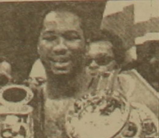
նի: Լյուիսի ներկայացուցիչները մատուցում են Կլիչկոյին բժիշկ հասկացնել, որը կհետագոյի բոնգամարտիկի ներկայիս վիճակը եւ կհաս իր եզրակացությունը: Եթե մինչեւ դեկտեմբեր Կլիչկոյի հետ մենամարտելու հնարավորություն չի կարողանա, ապա Լյուիսն այլ մրցակիցներ կփնտրի: Իսկ եթե մենամարտը կայանա, ապա, ըստ Լյուիսի, ինքը ծագելու է մրցակցին նկատուհի ենթարկել առաջին իսկ րոնում:

Ծանր Կապիկ կարգում որոշեցին նաև բոնգամարտի աշխարհի չեմպիոն Լեոնա Լյուիսը հայտարարել է, որ նախընտրում է Վիսալի Կլիչկոյին ռեանսի հասնելու հնարավորություն ընձեռել, քան մենամարտել Ռոյ Ջոնսի հետ: Գիշերքներ, որ նրանց մենամարտը դադարեցվել էր 6-րդ րոնում: Կլիչկոն վնասել էր իր ոտը եւ բժիշկը վճիռ էր կայացրել մենամարտը դադարեցնելու ու Լյուիսին հաղթանակ շնորհելու վերաբերյալ: Այդ մենամարտից հետո Կապիկ այն կարծիքին էր, որ Լյուիսը կնախընտրի հանդիման Ռոյ Ջոնսի հետ, ինչը նրան ավելի մեծ եկամուտ կբերեր: Սակայն Լյուիսն արդեն սկսել է բանակցել Կլիչկոյի ներկայացուցիչների հետ: Գնաքար է, որ մենամարտը կայանա արդեն այս արվա ղեկավարների 6-ին: Լյուիսը նշել է, որ Կլիչկոյի հետ մենամարտն իրեն դուր է եկել: Ըստ նրա, Լյուիսն էլ իրենց լավ դրսևորեցին: Լյուիսի կարծիքով, ինքը լավ մարզավորված է եւ վախճնալու ոչինչ չունի: