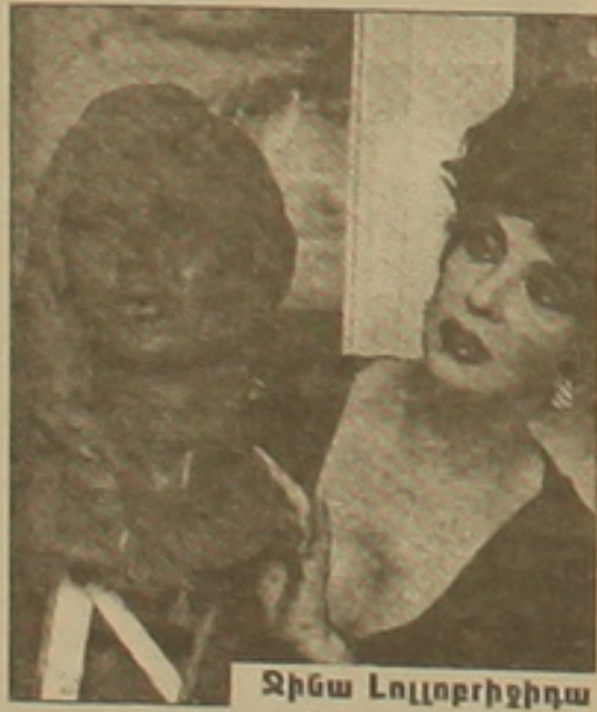
Ջինա Լոլլորիջի դեմ

Մոսկվայի փառասնունի ցուցակներում կազմակերպվել էր հավերժական Ջինա Լոլլորիջի մասնակցությամբ սեղծված ֆիլմերի հեռահայաց ցուցադրություն, որն ուղեկցվում էր նրա փառասնունի աշխատանքների ցուցահանդեսով: «Գեորգի Եստի ակադեմիան ավարտելուց հետո եւս մտադիր