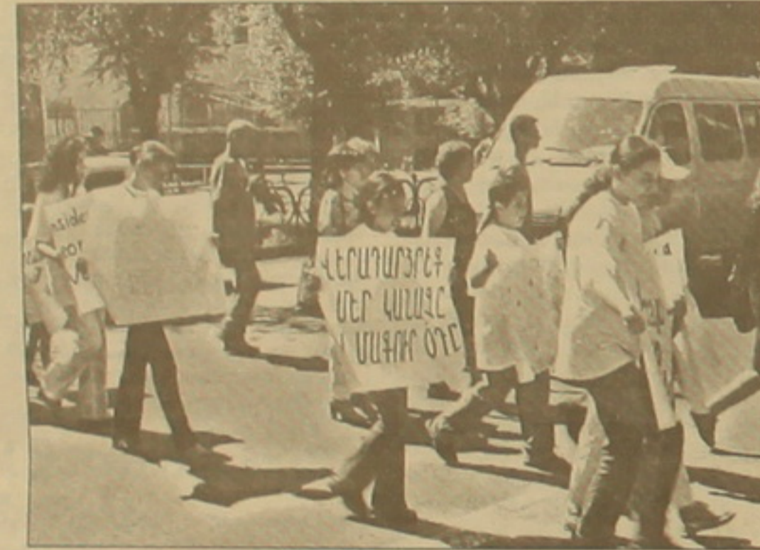
Վես ժամ անց զինված մարդիկ եկան մեր բակ, աղարարեց վերցրեցին եւ այնպիսի սղառնալիներ տեղա-

է ճնկել ինձ համար, ես էլ իմ թոռան համար միտքի ճնկեմ, նա երեխայի: Ոչ ոք բնությունը ոչնչացնելու իրավունք չունի: Ի՞նչ եմ կարծում, իրավանդություններն ինչու են այսօր անօգուտ: էկոլոգիական կրթություն չեն ստանում, անգրագետ են մեր երեխաները: Դրոցներում սնորհի մահաճուրկով է այդ առարկան դասավանդվում, կամ ոչ: Ինչու՞ ճաղողնաջի կամ գերմանացի երեխան ձեռքով օղակաձև գիտի ինչ է բնությունը, որ ղեկ է սիրել ու ղայարապետ, իսկ մեր երեխաները՝ ոչ: էկոլոգիությունից ղեկ է սկսել: