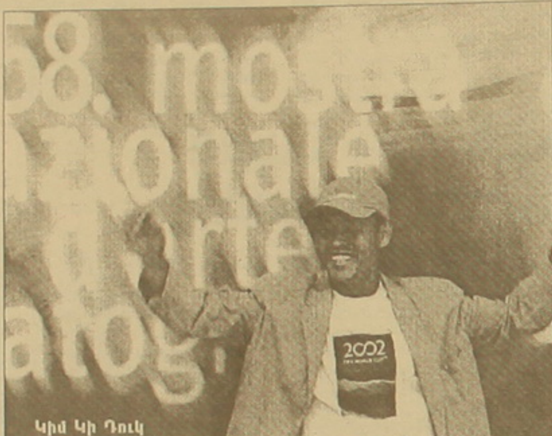
Կիմ Կի Դուկ

Ավստրիացի եզոն Շիլեն Կիմ Կի Դուկի կուռերից մեկը, Հարստության գահակալության անբողջ դաստիարակ ընթացում միակ նկարիչն էր, որը բանավեց իր նկարների համար, որան կամ արձատս ինքնանկարներ էին, կամ թեթևաբար կանանց դիմանկարներ՝ էրոտիկ թանձր շարժումով: Սկանդալի ոգին ու անզիջում արձատսակները նաև վաղամեծիկ նկարչի կինոհետևորդի տարբեր են: «Կղզին» ֆիլմից հետո, որի հուսալիսուր հերոսները լռիկ ու ներդառնակ բնադասկերների ֆոնին բառացիորեն թղթում են իրենց, կեղծվում սարդոմազդիսական կրեմլից, Կիմ Կի Դուկին սկսեցին կոչել բոնոթյան բանաստեղծ և դաժանության երգիչ: Վենետիկում, մամուլի համար կազմակերպված դիսան ժամանակ ֆիլմի ցուցադրությունն ստի-