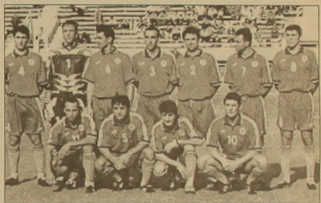
Ների հետ անցկացրած ընտանի խաղում զիջել է իր տեղը:

ՖԻՖԱ-ն հրադարձել է ազգային հավաքականների դասակարգման հերթական ցուցակը հունիսի 25-ի դրությամբ: Այդ ցանկում Հայաստանի ազգային հավաքականը 405 միավորով զբաղեցնում է 112-րդ հորիզոնականը: Նախորդ ամսվա համեմատ մեր ընտանի դասակարգման ցուցակում 7 տեղով նահանգել է: Սա զարմանալի չէ, քանի որ հունիսին մեր ընտանին ուղարկեցին թյանը՝ 111-րդ հորիզոնականում: Լավագույն շասնակցում մեխիկացիներին փոխարինել են չեխերը: Տասնյակի ներսում էլ չնչին փոփոխություններ են կատարվել: Կարելի է հասկառոտ նշել առաջին երկրորդ տեղերը զբաղեցնող հավաքականների միջև միավորների տարբերության կրճատման փաստը: Եթե մայիսին Բրազիլիայի եւ Իտալիայի ու Ֆրանսիայի հավաք-