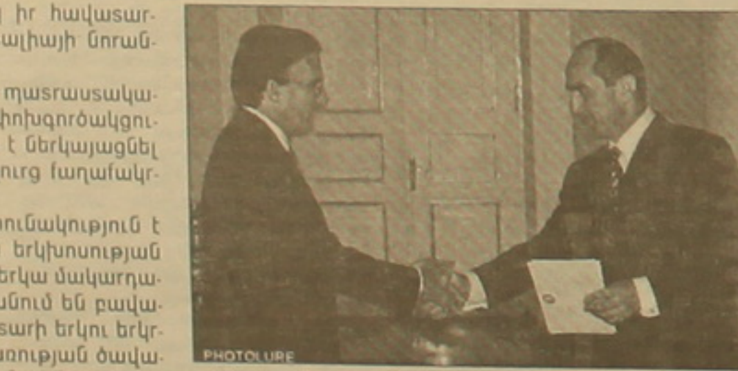
Ռոբերտ Բոչարյանը Իսախանյանի հետ հարաբերությունների զարգացումը կարեւոր է դիտել նաեւ Հայաստանի արտաին ֆաղափականության եվրոպական ուղղության համաստեղություն:

Նախագահ Ռոբերտ Բոչարյանին տեղի իր հավասարազորներ է հանձնել Հայաստանում Իսախանյանի նորանշանակ դեմական Մարկո Կլեմենտեն: Դիվանագետը հավաստել է իր երկրի դաստիարակականությունը ընդլայնել Հայաստանի հետ փոխգործակցության բնականները նեղելով, որ ուրախ է ներկայացնել Իսախանյանի մի երկրում, որն ունի հիմնավոր ֆաղափականություն եւ հարուստ մշակույթ: Հանրապետության նախագահը զոհունակություն է հայտնել հայ-իսրայելական ֆաղափական երկխոսության եւ սննեսական հարաբերությունների ներկա մակարդակի առթիվ բեռնելով, որ դրանք զարգանում են բավականին դինամիկ: Նրա խոսքով, սարեցարի երկու երկրների միջեւ աճում է աղտոտիչի բնականության մակարդակը, ընթացի մեջ են մի քանի ներդրումային ծրագրեր: Զուգակցությունը որպես փոխգործակցության հեռանկարային ոլորտներ նեղել են մշակույթը, զբոսաբերությունը: