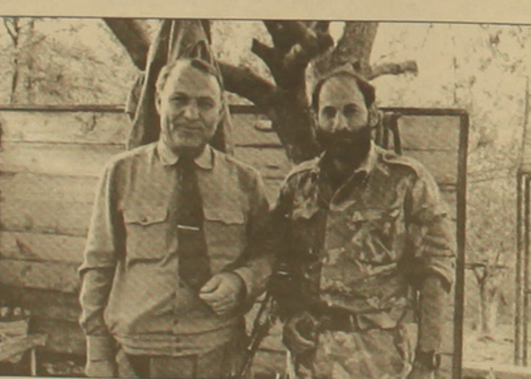
Գնդապետ (այժմ գեներալ) Հմայակ Հարյանը Մոնթե Մելիոյանի հետ:

Մարտունեցիները կոպում լավ փորձվել էին: Արդեն իսկ բույլ էին սալա, որ հակառակորդը հասնի մեր դիրքերին, ու մեզ համար ավելի դյուրին էր նրան ոչնչացնելը: Այդպիսի հնարներ էինք մտնեցնում: Եվ Մոնթեի, եւ իմ վարը ընկերներին այնքան բարձրացել էր, վերաբերումը՝ փոխվել: Մեր նկատմամբ ժողովրդի հա-