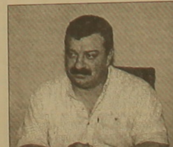
Մարզական նվաճումների համար: Ի դեպ, անցյալ տարվանից այդ մրցանակը դարձել է միջազգային, երբ ընտրվեց առաջին օտարերկրացուն՝ Հայաստանի նախագահ Ռոբերտ Զոյարյանին:

Հայ օլիգարխից բացի, «Ազնիվ մեթոդի և արժանավոր գործերի համար» մեդալով պարգևատրվել են եւս 20 անձին: Նրանց մեջ են Մուսկվայի Լադախայի Յուրի Լուկովը, Նովոսիբիրսկի մարզի նախագահ Վիկտոր Տոլոկոնսկին, թիվ Լեոնիդ Ռոսալը, առաջնական մարզուհի Լարիսա Լաշինին, Իոսիֆ Կոբզոնը և ուրիշներ: Մրցանակները հանձնվեցին «Պրեզիդենտ օբյեկտում», մի փանի սարի առաջ զոհված նախաձեռնող ակնարկով Սվյատոսլավ Ֆյոդորովին նվիրված ավանդական ամենամյա հուշ-երկրի ժամանակ: Այս մրցանակը ընդունվում է ֆալսեթի ակտիվ գործունեության, համապատասխան գիտության մեջ հանրաճանաչ ավանդի ներդրման, Ռուսաստանի հոգեւոր վերածնունդի նպատակով, ձեռնարկությունը ֆալսեթի հիմքեր վրա դնելու, ժողովուրդների փոխըմբռնման օժանդակելու, մեկուկուսի և