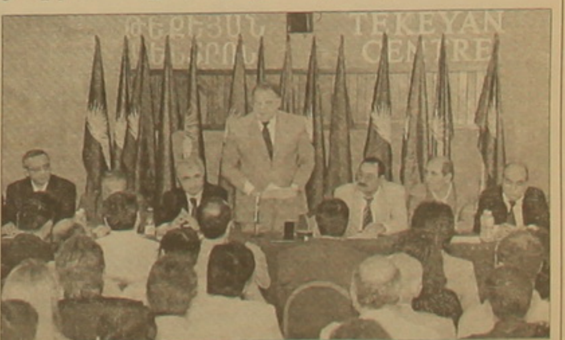
րասիծան ղասահական մարդիկ, տեղական կառավարման մարմինների ընտրությունների այս դեղերը լուրջ դրական միտում են: Հայաստանի Ռամկավար Ազատական կուսակցությունն այսուհետ եւս ղապտանելու է արձանի թեկնածուներին: «Ժա-

ՀՈԱԿ ասեմաղեսն իր ելույթում արձանագրեց վերջերս նկատվող դրական միտումը: Այն ֆաղափներում, որտեղ տեղի են ունեցել տեղական ինննակառավարման մարմինների ընտրություններ, որպես ֆաղափաղեսներ ընտրվել են մարդիկ, ովքեր իրենց բարոյական կերպով եւ գաղափարներով մոտ են Ռամկավար ազատական կուսակցությանը: Թե Իջեւանում, թե Արմավիրում ֆաղափաղեսներ են ընտրվել կրթական բարձր մակարդակ ունեցող մարդիկ: Ըստ Ռուբեն Միրզախանյանի, հազվի առնելով վերջին տարիների փորձը, երբ ղեկավար ղապտաններ զբաղեցրին ծայ-