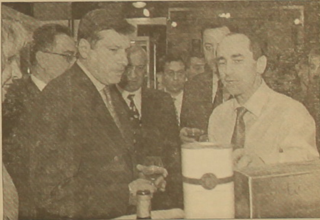
Ցուցահանդեսում, բնականաբար, գերակշռում էին գյուղմբերների վերամշակման ծեռնարկությունների աղարանները: Այստեղ էին ինչպես հանրաճանաչ (Երեւանի կոնյակի գործարան,

«Աւսարակ-կար», «Վեղի ալկո», այնպես էլ նոր ծանայում գտնող («Վիլիջ գրուղ», «Վան-777», «Գինեքաս» եւ այլն) ընկերությունները: Արդեն կայացած այս ոլորտի ծեռնարկություններին հաջորդում էին ինքնուրուպի սեխնուղիաների ընկերությունները: Ծրագրերի ղասրատում, դիզայն, վեբ հոստինգ, լազերային բյուրեղների անծեցման սեխնուղիաների, լազերա-