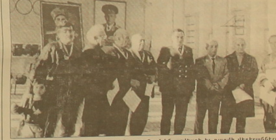
Պաստերի մարզիկներին ողջունում են արվեստի եւ ռազմիկ վեթերանները: Կենտրոնում՝ գեներալ Արկադի Տեր-Թադեոսյանը

Մրցաճարը ծառայեց նմաստակին, ի հայտ եկան նոր անուններ, եւ համոզված ենք, որ մրցաճարի հաղթողներից ցածրն արագալույս կարող են հաջողության հասնել միջազգային բարձր մակարդակի մրցումներում, ինչուիսի արդյունքի ժամանակին հասել են Արմեն Նազարյանը (օլիմպիական խաղերի չեմպիոն), Արայիկ Գեւորգյանը (աշխարհի եռակի չեմպիոն), Արմեն Սկրչյանը (Եվրոպայի