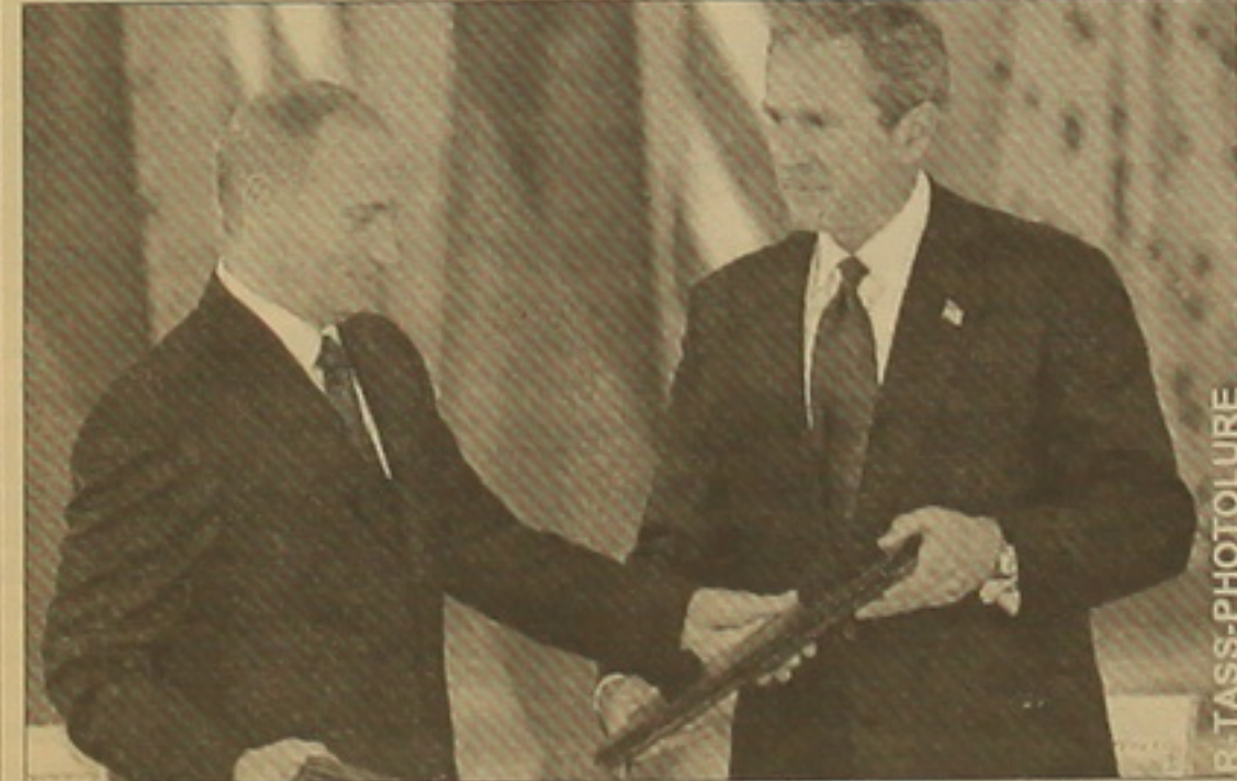
Մամլո ասուլիսի ընթացքում Ջորջ Բուրը և Վաշինգտոնի նախագահ Վլադիմիր Պուսիսը: Մամլո ասուլիսում զգացվում էր, որ մի քանի րոպեներում երկու ղեկավարների տարածաշրջանները չեն հարթվել: Այսպես, ռուս-իրանական կառուցողական հարցում ԱՄՆ-ի վերաբերմունքն արտահայտելով Ջորջ Բուրը հայտարարեց, թե Մոսկվան եւ Վա-

Երեկ 26-ին, Սուրբ Գրիգոր Լուսավորչի տաճարում կայացրեցին զարգացող Արցախի կարողությունների մասնակցությանը: Գալով խորհրդաժողովին 33 արտաստանախարարն ասաց, որ այս մեկը միայն չի համահայկական առաջին հավաքի բարեկարգությունը: Մասնավորապես, դեռ այն ժամանակ որոշում ընդունվեց առանձին ոլորտ-