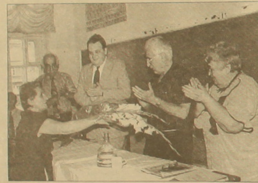
1995 թ. ՀՈԱԿ Եւրոպական հանդիպում: Ծաղկեփունջ Վարդեփունջ

Ֆրունզե Դովլաթյանը 1950 թ. 23 արեւելանում, արժանացավ Ասախնյան մրցանակի «Այս աստիճանը մերն են» ներկայացման գլխավոր դերակատարման համար: Ասացավ դիմադրող, որը ստորագրել էր անձամբ «ժողովուրդների ուսուցիչ» այն ժամանակ, երբ նման մասկի չէին արժանացել ոչ վահրամ Փափազյանը, ոչ էլ Հայոց Ներսիսյանը եւ ընդհանրապես ոչ մեկը մեր թատրոնի եւ կինոյի գործիչներից: Որոշել էին ունեւ է երիտասարդ մեկը մարգեւսրվի: Հետագայում, երբ Դովլաթյանն արդեն որոշեց կայացած եւ մեծագույն ռեժիսոր կրում էր բոլոր հնարավոր բարձր կոչումները, մասագամակուն էր խորհրդային վերջին տարիներին եւ մաս էր կազմում Կոմկուսի ղեկավար մարմնի, դժվար էր ենթադրել, որ, ինչպես նրան ունեւ համարում էին, «բոլոր ռեժիսորների կողմից սիրված արվեստագետ» մաս կկազմի կառուցողական ընդդիմության դիրքում գտնվող Հայաստանի Ռամկավար Ազատական կուսակցության Հանրապետական վարչության, կրեկավարի Հայաստանի Թեմեյան մեակության միությունը, չի «ընտրվի» Հայաստանի Ազգային ժողովի մասագամակուն (ավելի ճիշտ կորոշեն, որ որոշեց ասմակավար չոթեւ է լինի այդպիսին), կողարգեւսրվի անկախ Հայաստանի մեղալով, Կանգի Բանեանները յուրային հավասարիմ գավառականների համար էին, իսկ նրան նմիված գրույկը «բարձր հովանավորությամբ» լույս կտեսնի միայն հետմահու: Եվ այս ամենը նույնպես վկայում է Դովլաթյանը մեծագույն մարդ էր, Կաղափարի, ճամարի եւ սկզբունական ամեն ինչում, ամեն դասին: