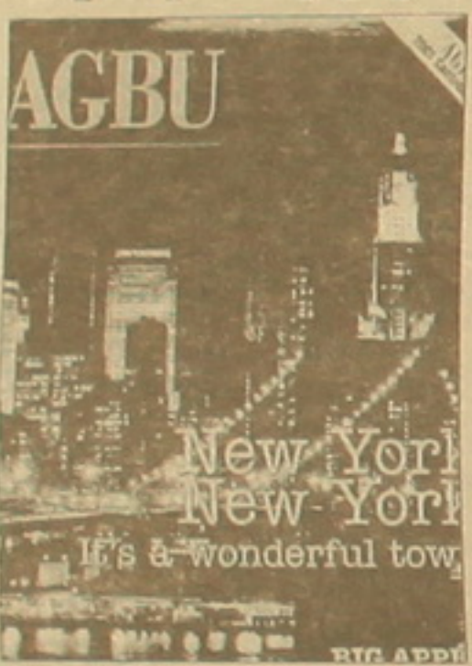
ԱՄՆ ժամանած Տարբեր էթնիկական խմբերը:

Վերջինս: Այնուհետեւ «Լյուի Յորիում հայերի հետեւում» ընդհանուր խորագրի ներքին ներկայացված են աշխարհում մեծագույնի հռչակ վայելող Լյուի Յորիի հայկական համայնքի ներկայացուցիչների մի փոքր մասն ու Լյուի Յորիի բարեգործական գործունեությանը ունեցած ներդրումը: