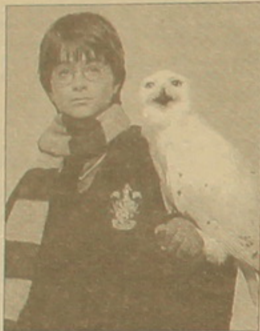
Կարի Փոքեր «Տարի Փոքեր» ֆիլմից

Թեև անցյալ տարի ամառը երկրամասում ֆիլմերի մի մասը դեռ չի իջել էկրաններից, բայց արդեն հայտնի են 2001-ի դրամալոգային չեմպիոնները: Հասկանալի է, որ թե ամերիկյան, թե արևմտաեվրոպական հանդիսատսից ամենամեծ հասույթները «կորզած» կինոհիթերի ասանյակը զուտ հոլիվուդյան արտադրանք է «բլոքբասթերներ», արկածային կամ ֆանտաստիկ ժառանգներ, հեծիաթներ կամ համակարգչային մուլտիմեդիայի նմուշներ: Զարե գլուխ կոտրելով դրամաները կ'ընդհանրապես արեալքը, թե՛ ընդհանրապես արեալքը: