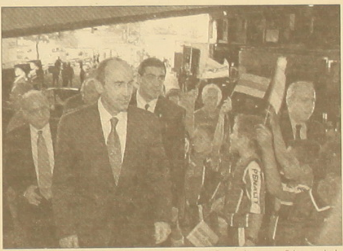
Բանակի առումով: Համաժողովի ավարտից հետո մարդիկ մնացել էին եւ ծանոթանում էին նյութերին: Հուսով եմ, որ դեսպանասան բացման հարցն այստեղ կփորձեն լուծել:

ԱՐԻ ՄԱՐՏԻՐՈՍՅԱՆ, Երեկ հարավամերիկյան երեկ երկրներ (Արգենտինա, Ուրուգվայ, Բրազիլիա) կատարած այցից հետո Երեւան վերադարձավ նախագահ Առքերս Բոչարյանը: Բնակամարտ, նրան ուղղված առաջին հարցն առնչվում էր այցի զննահասականին եւ ակնկալիներին: - Բավական ծանրաբեռնված, նաեւ հետաքրքիր այց էր: Երեկ երկրներում էլ ստորագրվեցին մեր սնեստական հարաբերությունների կամոնակարգմանն ուղղված փաստաթղթեր: Իհարկե, Արգենտինայի ծանր սնեստական վիճակն այն տղավորությունը թողեց, որ այդ երկիրը օտս ավելի կենսոնացած է իր խնդիրների վրա, բայց խղաղական հարաբերությունների առումով հետաքրքիր էր բովանդակալից ֆննարկումներ եղան: Կառանձնացների Բրազիլիայի մեր սնեստական համաժողովը, որը մեծ հետաքրքրություն առաջացրեց մասնակիցների