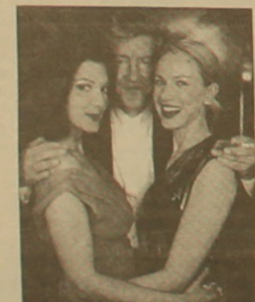
Դեյվի Լինն իր «Մալիուանդրայի» գերակատարներին հեծ

նեն Կաննի մրցութային ծագում: Իսկ այս տարի, ինչպես եւ անցյալում, Կաննը ի մի կերպի համաձայնարարային կինոյի ընթացում: Իրենց նոր ֆիլմերը կներկայացնեն Վուդի Ալենը, Մարտին Սկորսազեն, Ռոման Պոլանսկին, Մայլ Լին, Դեյվի Բրոննեբերգը, Կլոդ Լեյուզը, Կլեյ Դենին, Թոմաս Վինսենթերը եւ այլ: Ամենայն հավանականությամբ, փառատոնում կցուցադրվեն նաեւ Գայ Ռիչի, Դենի Բոյլի, Սթիվ Սոդերբերգի, Գաս Վան Սենթի վերջին ժառանգները եւ նույնիսկ Սոֆի Մարոյի լիամետրաժ ֆիլմերը: Նրանք 1995-ին դարձյալ Կաննում ցուցադրված նրա առաջին կարճամետրաժից հեծ: