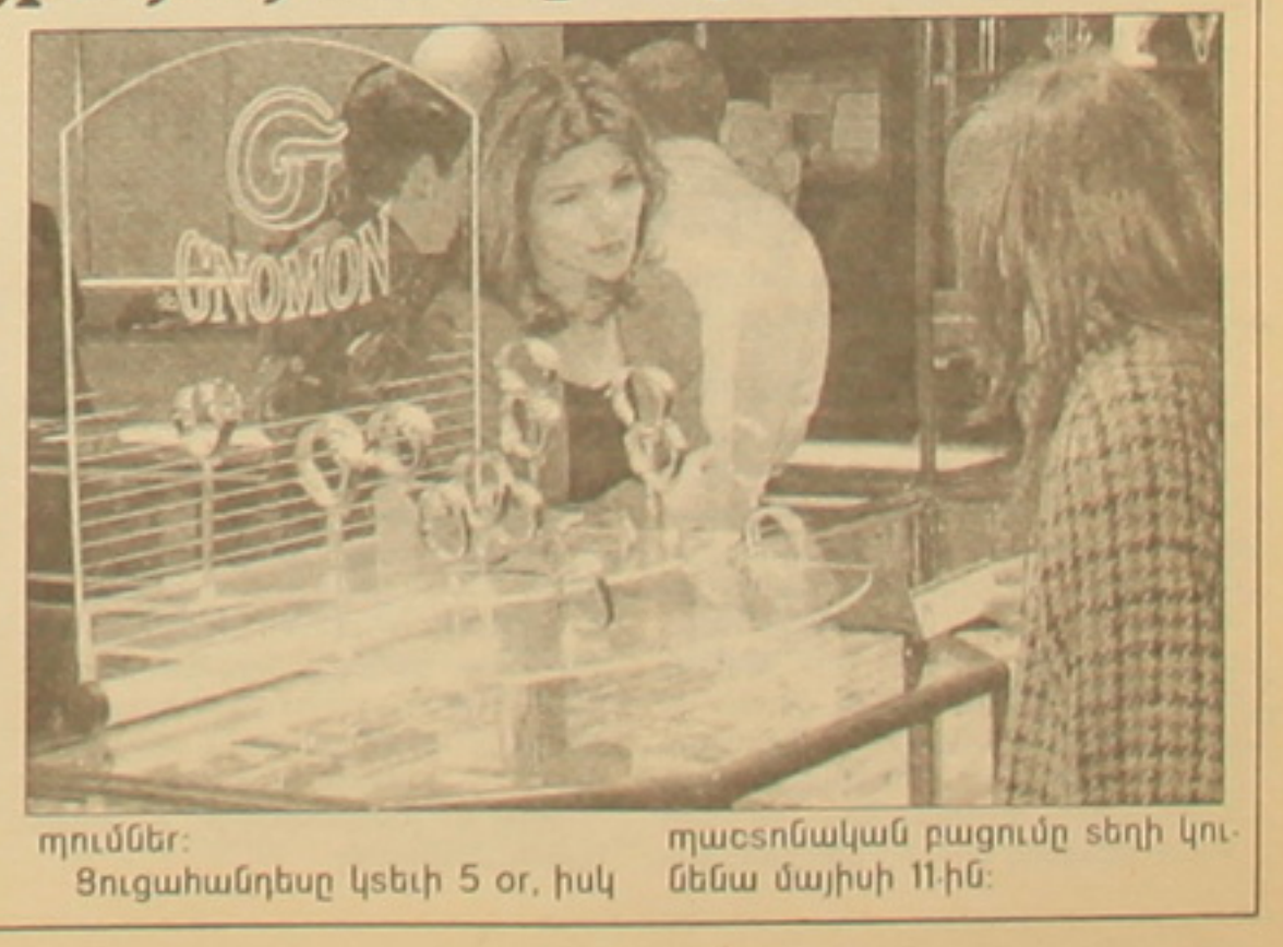
ղումներ: Ցուցահանդեսը կեսի 5 օր, իսկ լղաեսոնական բացումը տեղի կունենա մայիսի 11-ին:

Երեւան, 10 սեպտ, ՆՈՅՅԱՆ ՏԱՊԱՆ: Մայիսի 10-ին երեւանում սկսվեց Հայաստանի ոսկերիչների միության կազմակերպված «Ոսկեգործություն-2002» միջազգային 5-րդ ցուցահանդես-վաճառքը: Դրան մասնակցում են թանկարժեք եւ կիսաթանկարժեք ֆարերի մեակամար, ոսկերչական իրերի, սարվալորումների եւ գործիքների արսաղրությամբ եւ վաճառով գրաղղող մի ֆանի սասնյակ ընկերություններ, այդ թվում ֆիրմաներ Ուկրաինայից, Կանադայից եւ ճաղոնիայից: Բացի անվանը համահունչ արսաղրեստակներից, ցուցահանդեսին կենրկաղացվեն նաեւ նորաճեության եւ կիրառական արվեստի նմուսներ: Ցուցահանդեսին զուգահեռ կկազմակերպվեն նաեւ գործարար հանդի-