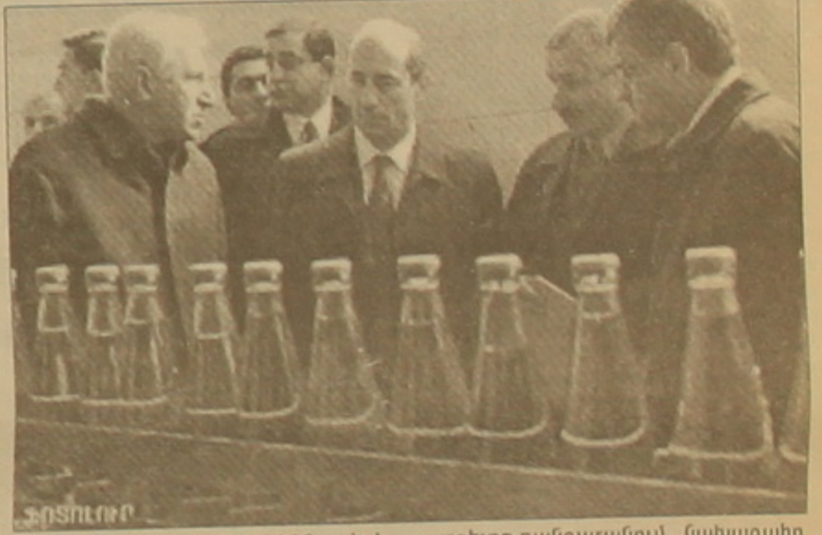
Վարձը նախատեսվում է 2003 թ. հոկտեմբերին: Թուրքիայի կառուցումով Սեւան-Դիլիջան ավտոճանապարհը կկառուցեն 4,2 կմ-ով, ուղղանների և անաղբի 8-ով: Հիմնարկության արժեքը 6,7 մլն դոլար է, որի ֆինանսավորումն իրականացնում է Լիսի հիմնադրամը: Նոր-նոր սկսված շինարարության մեջ արդեն ընդգրկված է 250 մարդ: Այստեղ ընթացող աշխատանքներին ժամանակացույց հետ, Որբեր Բոչարյանը մեկնեց վերջին ամիսներին մեր երկրային հայտնված նոր «Դիլիջան-Ֆրոլովա» համայնքի քրի արտադրության գործարան: Այն իր գործունեությունն է սկսել անցյալ սարվա սեպտեմբերին, սակայն արդեն հասել է 10 հազար շիշ օրական քուրունակության: Իսկ լրիվ հզորության

ԵՐԵՎԱՆ, 26 ԱՊՐԻԼ, ԱՐՄԵՆՊՐԵՍ: Երեսնամյա մինչեւ սահման կունենանք որակյալ ճանապարհ ընդունում է 2003 թ. հոկտեմբերին: Թուրքիայի կառուցումով Սեւան-Դիլիջան ավտոճանապարհը կկառուցեն 4,2 կմ-ով, ուղղանների և անաղբի 8-ով: Հիմնարկության արժեքը 6,7 մլն դոլար է, որի ֆինանսավորումն իրականացնում է Լիսի հիմնադրամը: Նոր-նոր սկսված շինարարության մեջ արդեն ընդգրկված է 250 մարդ: Այստեղ ընթացող աշխատանքներին ժամանակացույց հետ, Որբեր Բոչարյանը մեկնեց վերջին ամիսներին մեր երկրային հայտնված նոր «Դիլիջան-Ֆրոլովա» համայնքի քրի արտադրության գործարան: Այն իր գործունեությունն է սկսել անցյալ սարվա սեպտեմբերին, սակայն արդեն հասել է 10 հազար շիշ օրական քուրունակության: Իսկ լրիվ հզորության արգելոց-բանգարանում նախագահ Երեւանում սահմանվել է, որտեղ արտադրվում են հնատն զորգեր, այլ իրեր, նկարներ, գույքեր համալիրի տնօրենի եւ աշխատակիցների հետ: Դրանցից հետո Դիլիջանի ֆաբրիկայի ներքին, որին մասնակցում էին նախարարներ եւ մարզային իշխանությունների ղեկավարներ: Խորհրդակցության ավարտից հետո նախարարը գույքի բովանդակը ֆաբրիկային առջին խմբից մարդկանց հետ: Նրանք Որբեր Բոչարյանին ներկայացրին իրենց սոցիալական ծանր վիճակի եւ դրանցից բխող բազում դժվարություններին վերաբերող հիմնախաղերը: