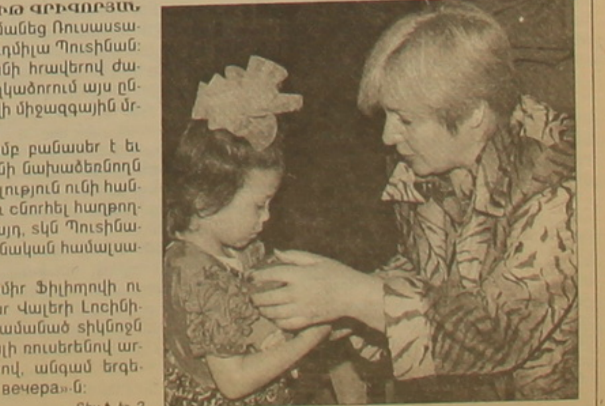
Որ կրթության նախարար Վլադիմիր Զիլիդովի ու ՌԴ առաջին փոխարտգործնախարար Վալերի Լուցինի ուղեկցությամբ համալսարան ժամանած տիկինը ռուսաճողները դիմավորեցին հիանալի ուսերենով արասանված բանասերություններով, անգամ երգեցին իրեն ու բարի «Подмосковные вечера»-ն:

ՄԱՍՏ ԳՐԱԳՈՐՅԱՆ: Երեկ ետոյա այցով Հայաստան ժամանեց Ռուսաստանի Դասնության առաջին տիկին Կուղմիլա Պուսիսան: Մեր առաջին տիկին Բելա Բոչարյանի հրավերով ժամանած Լ. Պուսիսան այստեղ է ծաղկանոթում այս ընթացքում անցկացվող «Ռուսաց լեզվի միջազգային մրցույթի» օրջանակներում: Նա, որ, ի դեմք, մասնագիտությամբ բանասեր է եւ ռուսաց լեզվի զարգացման կենտրոնի նախաձեռնողը իր երկրում, մասնավորապես, առաւելություն ունի հանդիսավոր կերպով փակել մրցույթն ու շնորհիլ հարթողներին մրցանակներ: Սակայն մինչ այդ, սկն Պուսիսանի այցը մեկնարկեց Երեսնամյա Սլավոնական համալսարանից: