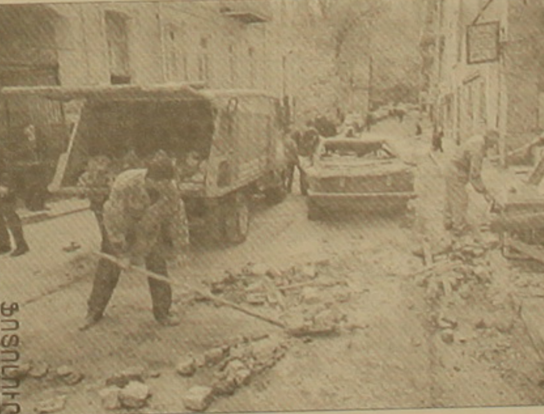
Ուղևորություններ: Ապրիլի 26-ի վաղ առավոտյան Թբիլիսիում գրանցվել է նոր 2 բալլ ուժգնությամբ երկրաւարձ: Չոհեր եւ ավերածություններ չկան: Ընդհանուր վնասը կազմում է շուրջ 100 մլն դոլար: