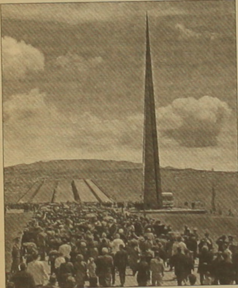
Երեւան, 24 ԱՊՐԻԼ, ԱՐՄԵՆԻՅԵՆ։ Այսօր վաղ առաւոսից հայ ժողովրդի զավակները Երեւանի Ծիծեռնակաբերդի բարձունք սանող բոլոր ծանփաներով արժվեցին դեղի 1915 թվականի Հայոց ցեղատղաւորայն զոհերի հուլարծան իրենց հարգանի սուրբ մասուցելու եղեսնի զոհերի հիլաակին։ Նրանց հետ հավերժական կրա-

կի մոս զլուիս խոնարիեցին նաեւ ալաարիի արբեր կողմերից ժամանած հյուրեր, Հայաստանում հավասար-մաղրված օտարերկրյա դիվանագետներ, միջազգային կազմակերղությունների, արբեր երկրների լրասվական ծաղայությունների ներկայացուցիչներ, այղ թվում՝ Թուրքիայի հեղուսարղաղղներ, որոնք նկարահանումներ արեցին CNN-ի համար։